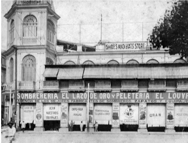
LA Manzana de Gómez en la última década de 1800

Todo parece indicar que la primera de las tiendas que aparecieron en el lugar fue una peletería que se abre en la parte de San Rafael nombrada La Exposición y en Zulueta otra muy conocida resultó El Lazo de Oro.