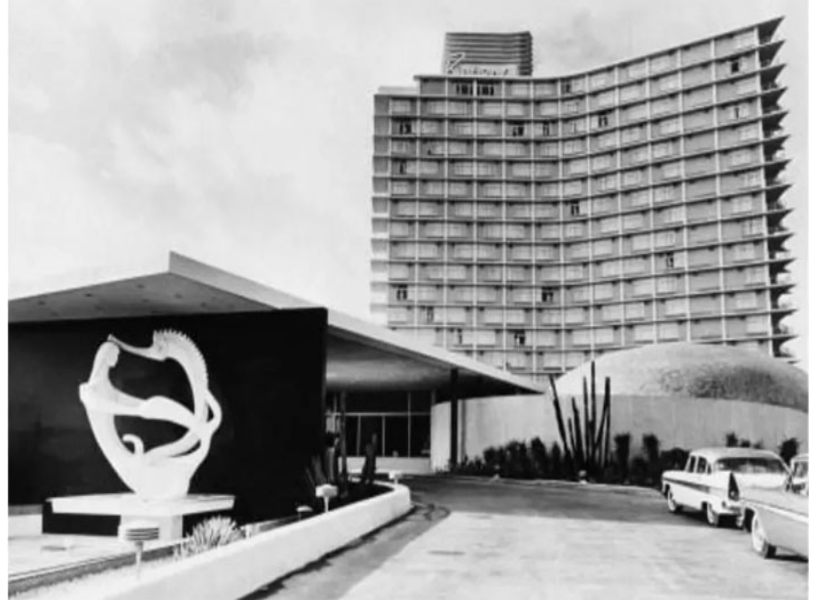
Hotel Habana Riviera

El hotel Habana Hilton, hoy Habana Libre