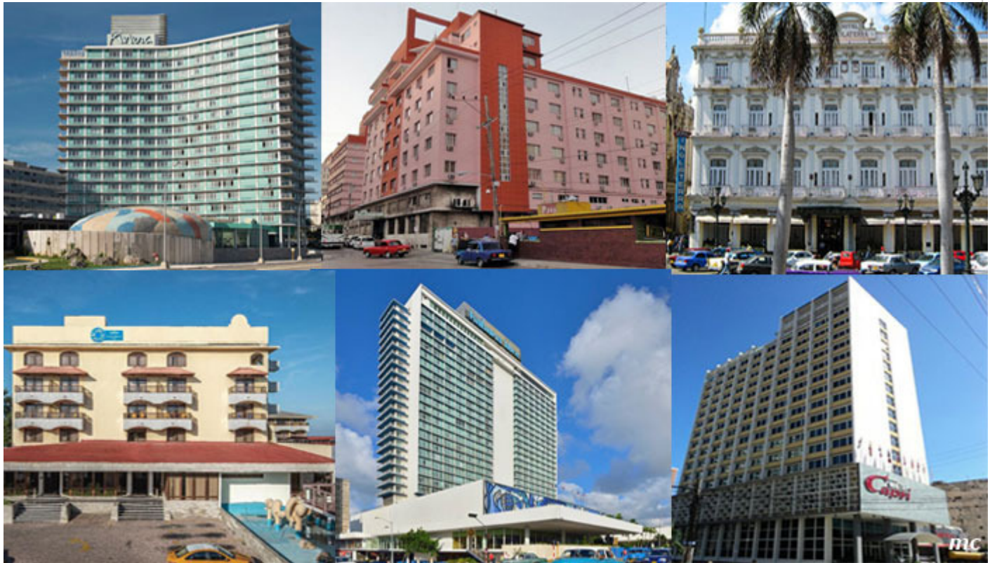
Hoteles importantes de La Habana