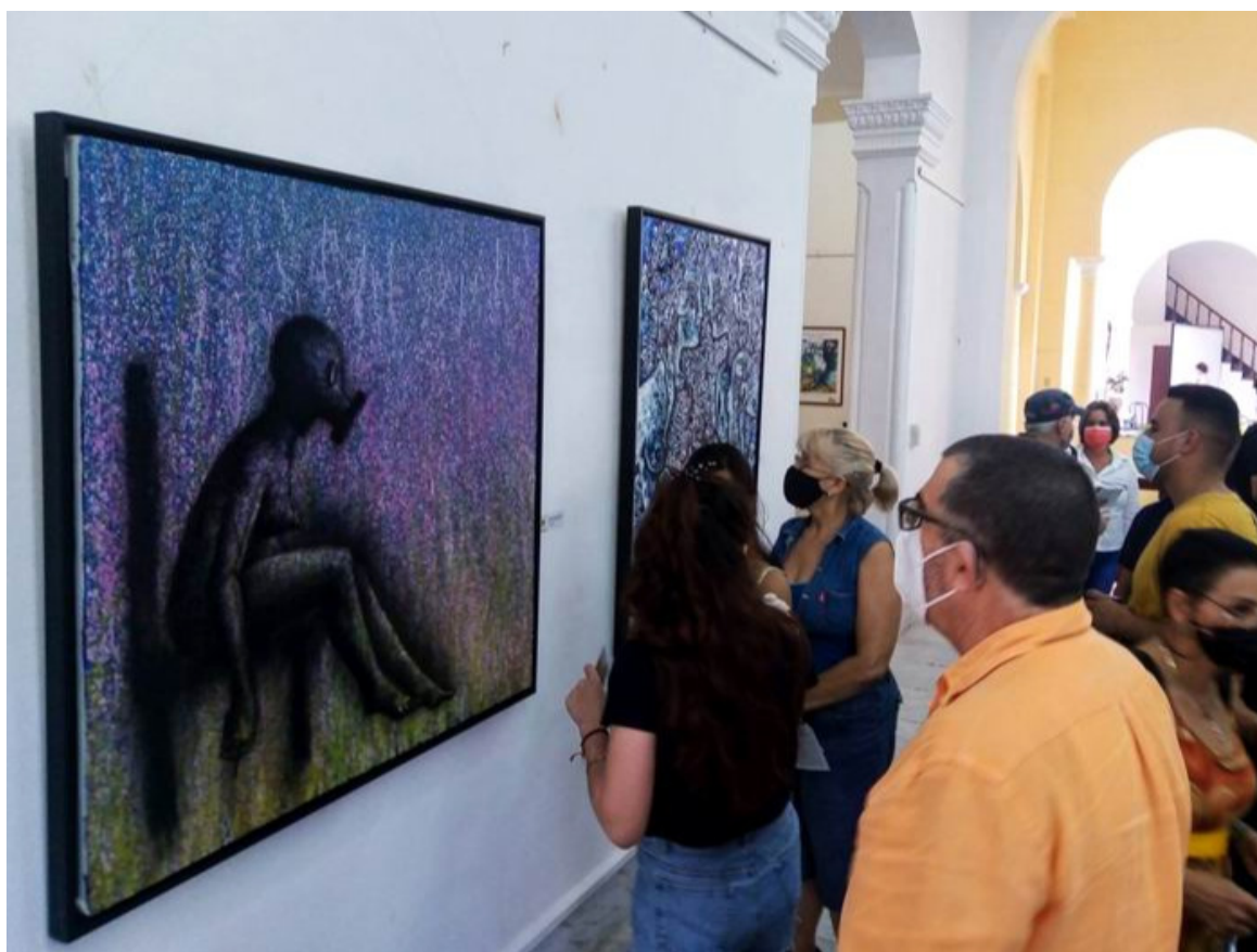
Galería Provincial de Arte de Villa Clara engalana sus salas expositivas con la muestra bipersonal “Aliento”,