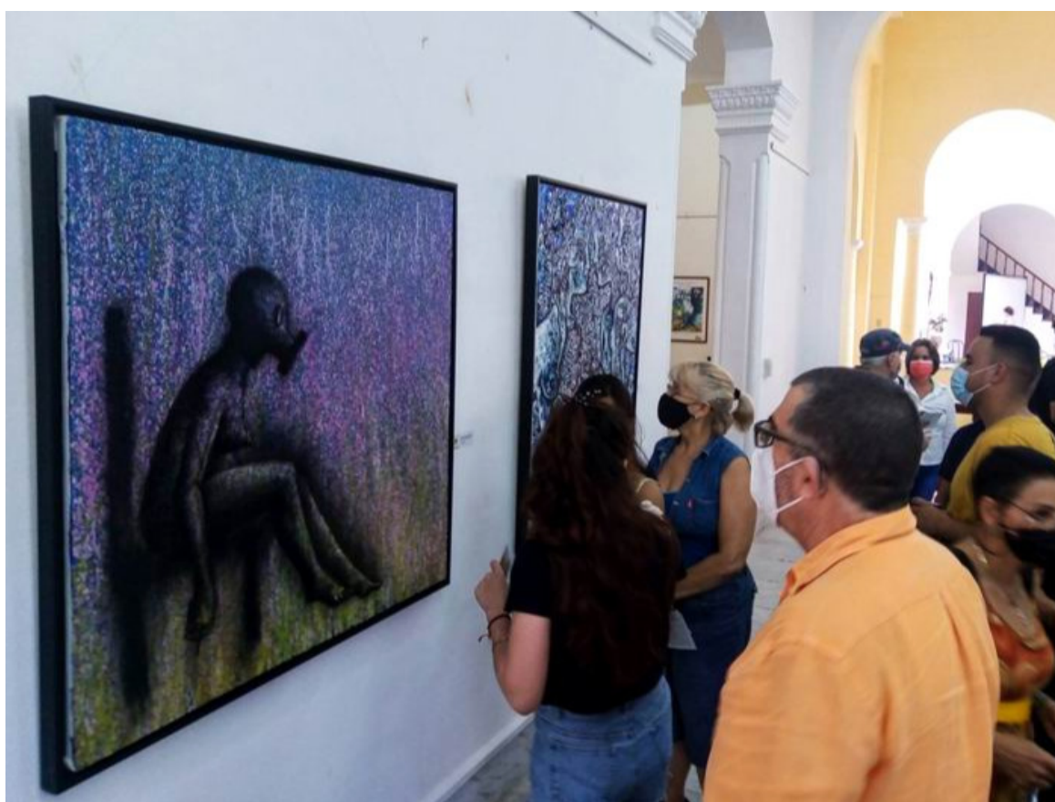
Galería Provincial de Arte de Villa Clara engalana sus salas expositivas con la muestra biperpersonal “Aliento”,