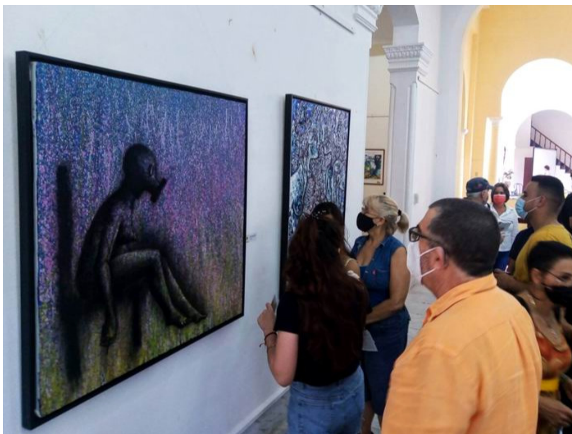
Galería Provincial de Arte de Villa Clara engalana sus salas expositivas con la muestra biperpersonal “Aliento”,