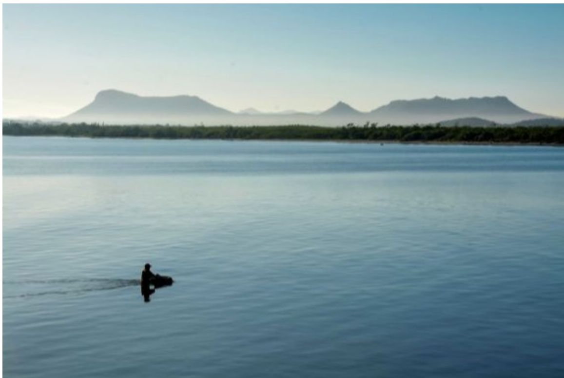
El paisaje descrito en el Diario de Navegación de Cristóbal Colón, tras el descubrimiento de la Isla

Holguín, 25 ene (RHC) El paisaje descrito en el Diario de Navegación del almirante genovés Cristóbal Colón, tras el descubrimiento de la Isla por Cayo Bariay, puede apreciarse en el entorno geográfico de la actual ciudad costera de Gibara, provincia Holguín.