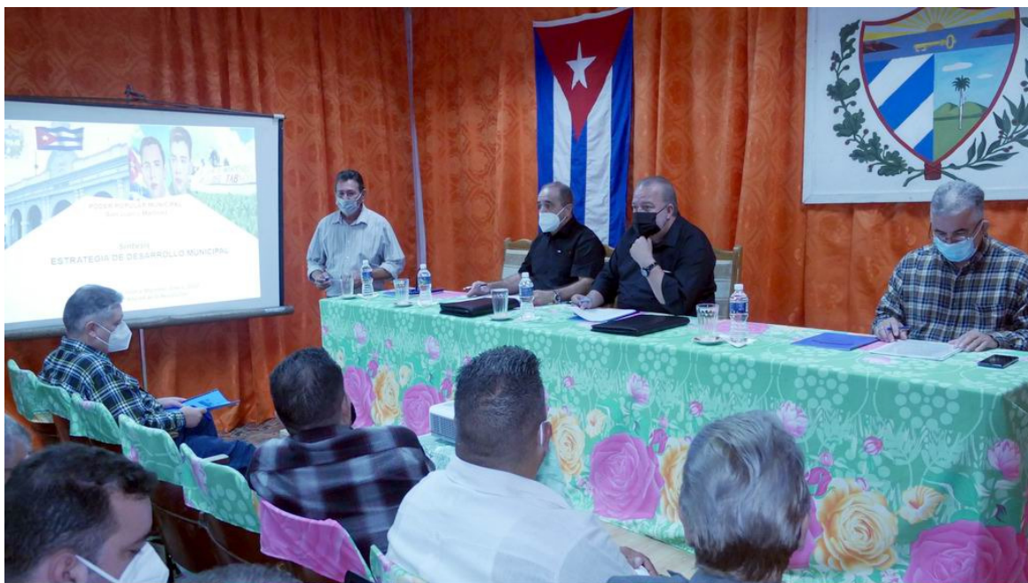
Aboga Marrero Cruz por estrategias de sostenibilidad y desarrollo

Pinar del Río, Cuba, 28 ene (RHC) El primer ministro de Cuba, Manuel Marrero Cruz, encabeza este viernes la segunda jornada de la visita gubernamental a la provincia occidental de Pinar del Río.