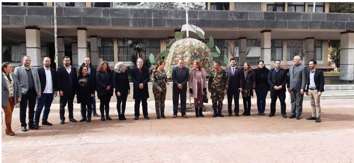
Conmemoran en Siria dos fechas nacionales de Cuba

Damasco, 31 ene (RHC) Sirios y cubanos celebraron este lunes en Damasco los aniversarios 63 del triunfo de la Revolución Cubana y el 169 del natalicio del Héroe Nacional José Martí.