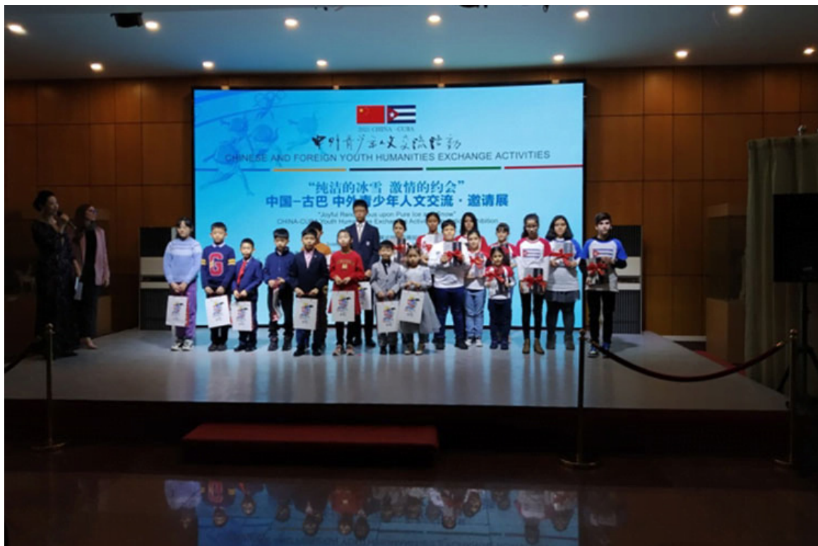
Cuba y Beijing 2022, enlazados mediante el arte y los niños

Beijing, 4 feb (RHC) Por su condición de país tropical Cuba no participa en olimpiadas invernales, pero dejó una huella camino a las de Beijing 2022 gracias a iniciativas que involucraron a su cultura y sus niños.