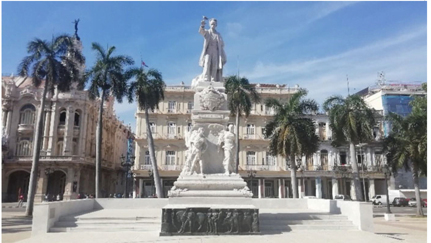
Monumento a José Martí en el Parque Central