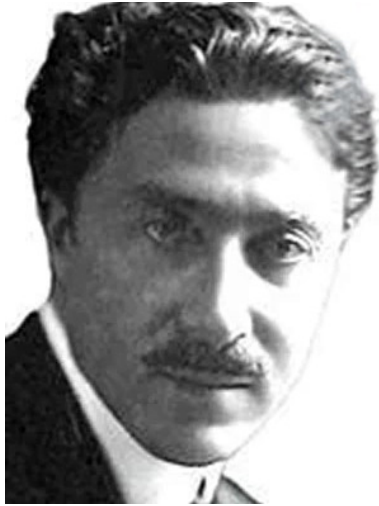
Escultor italiano Aldo Gamba

Aldo Gamba tenía mala sombra. El monumento a Máximo Gómez que se convocó en 1916, debía quedar listo en 1919. Disponía de un presupuesto de 200 000 pesos, y ahí mismo comenzaron los inconvenientes. La prensa y los artistas plásticos cubanos se ensañaron con la propuesta de Gamba, triunfador entre los proyectos de otros 40 artistas. Se reconvino la forma en que sesionó el jurado y se reprochó al monumento su exceso de referencias clásicas, su desarraigo y carencia de identidad. Las críticas llegaron a la burla cuando en alusión al templete que sirve de apoyo a la escultura se dijo que en la obra el caballo de Gómez estaba encaramado en una azotea. El Congreso de la República terminó retirándole el premio concedido, pero Gamba apeló a los tribunales y hubo que respetar el fallo del jurado.