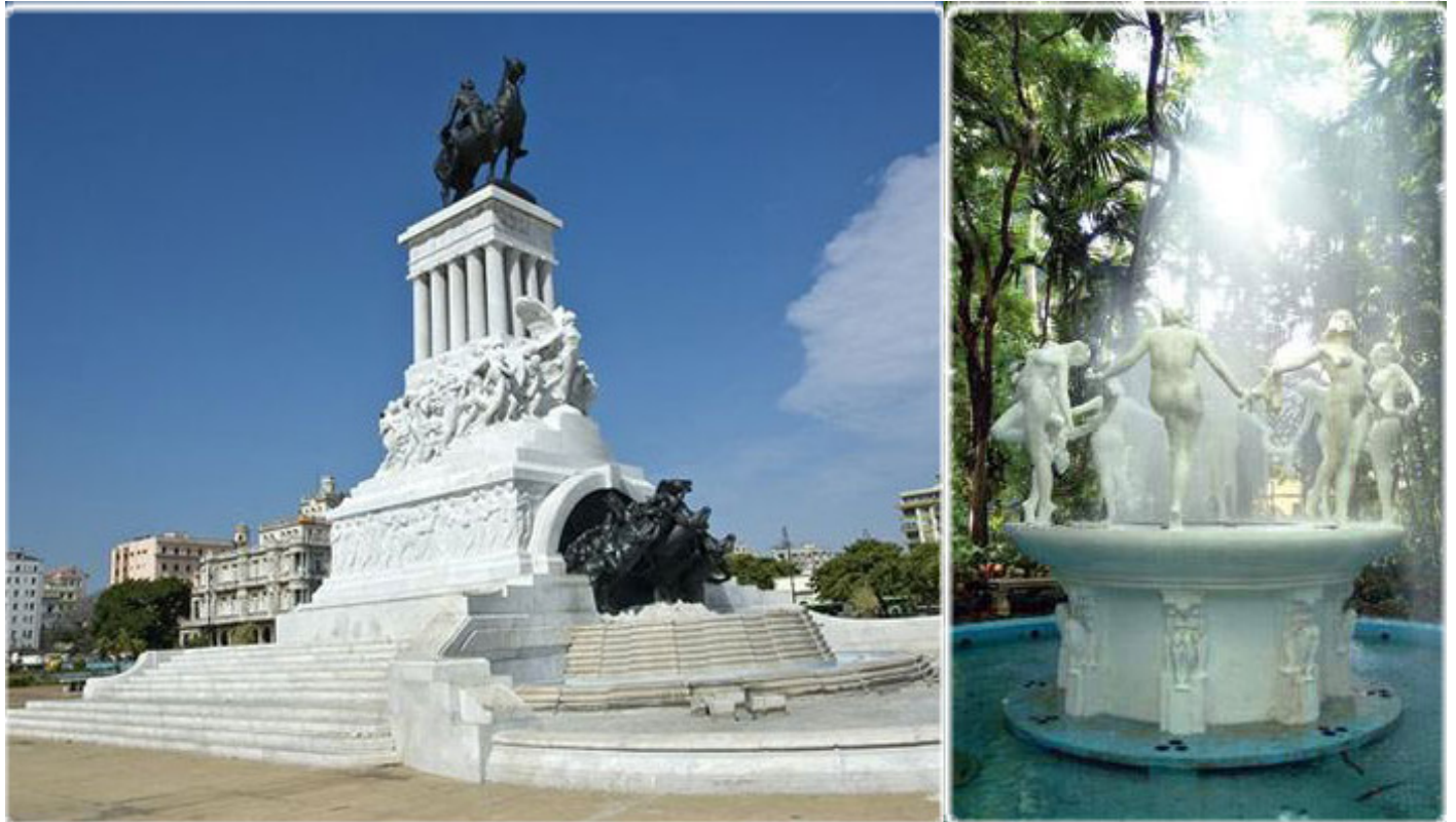
Dos monumentos en la Habana realizados por Aldo Gamba

espiritano Alejandro Rodríguez, en la intersección de Paseo y Línea, y el fastuoso monumento al mayor general José Miguel Gómez, segundo presidente de la República, en G entre 27 y 29.