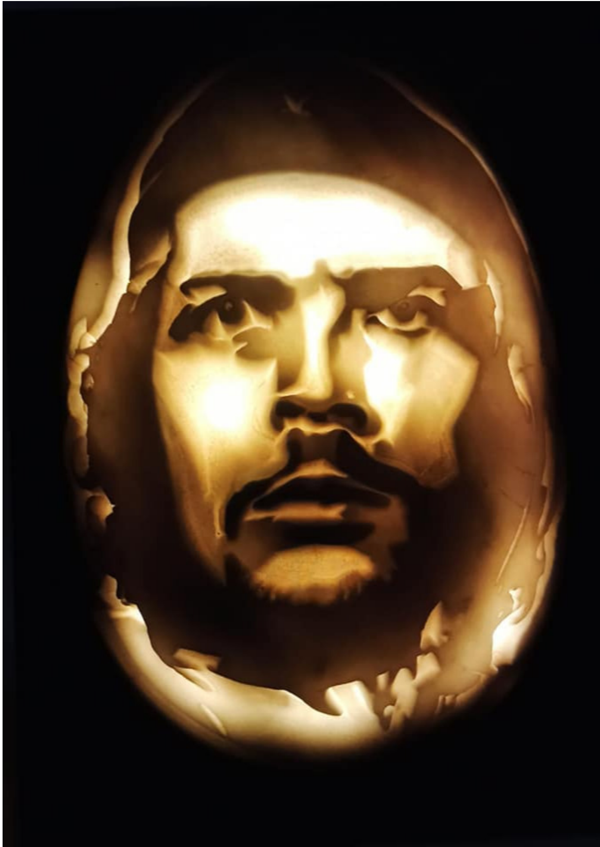
Hacia Cuba escultura del Che donada por artistas italianos