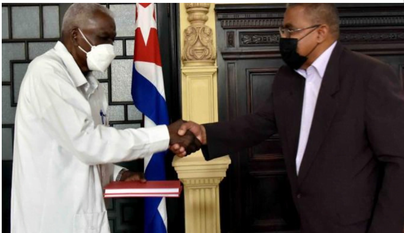
Esteban Lazo y Rubén Remigio Ferro

La Habana, 18 feb (RHC) Los proyectos de leyes de Ejecución Penal y Código Penal se encuentran disponibles desde hoy en sitios web gubernamentales de Cuba como parte del proceso de consulta para su aprobación.