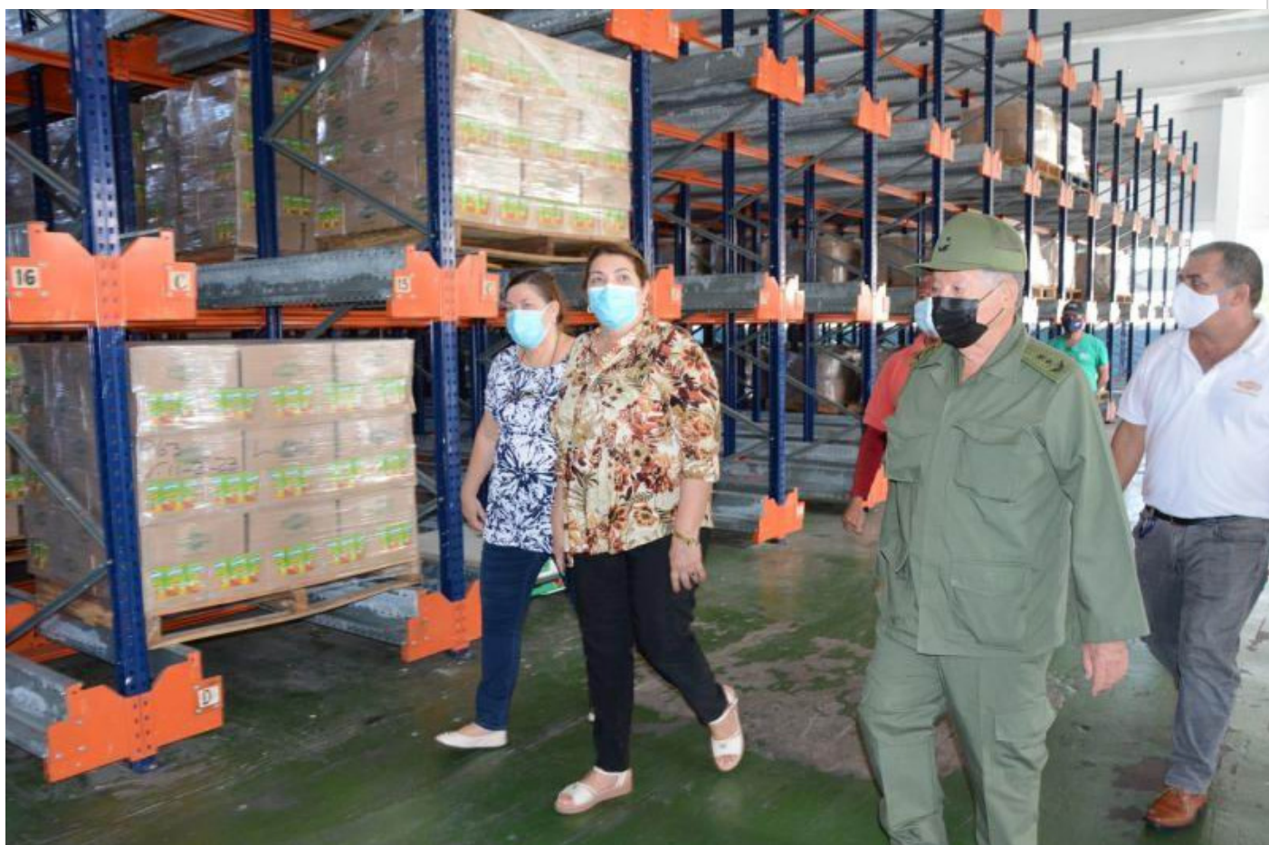
Inicia Estado Mayor Nacional de la Defensa Civil control integral a Sancti Spíritus

Sancti Spíritus, 22 feb (RHC) La actualización del Plan de Reducción de Riesgo de Desastres es una fortaleza para enfrentar cualquier evento afirmó en Sancti Spíritus el jefe del Estado Mayor Nacional de la Defensa Civil, General de División Ramón Pardo Guerra.