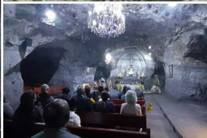
Cubanos celebran en Colombia entronización de la Caridad del Cobre.

Bogotá, 11 may (RHC) Los miembros de la misión estatal de Cuba en Colombia visitaron la víspera la Catedral de Sal donde se encuentra una imagen de la Virgen de la Caridad del Cobre.