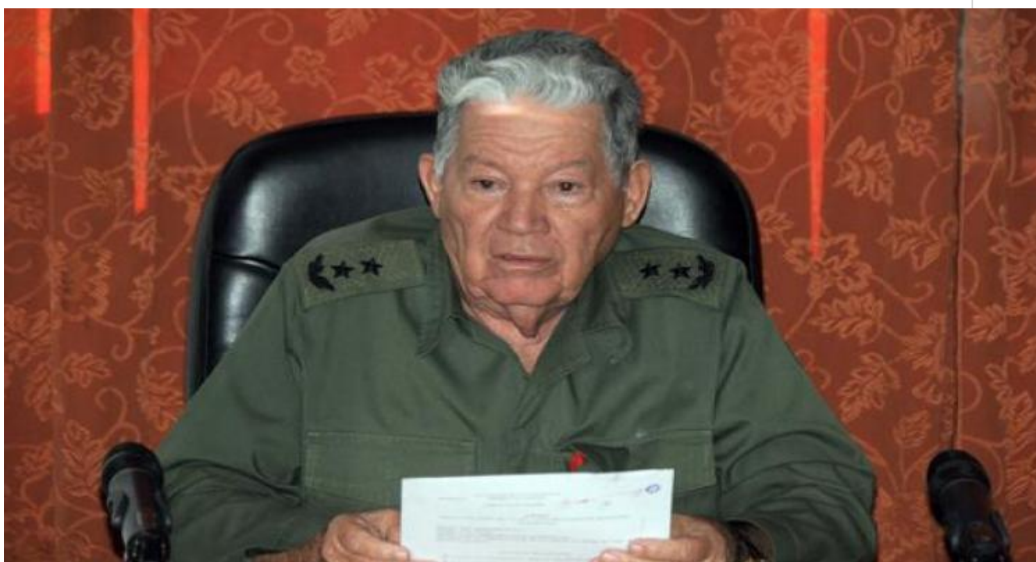
El jefe del Estado Mayor Nacional de la Defensa Civil, General de División (R) Ramón Pardo.

La Habana, 11 may (RHC) La Representante en Cuba del Fondo de Naciones Unidas para la Infancia (Unicef), Alejandra Trossero, y el jefe del Estado Mayor Nacional de la Defensa Civil, General de División (R) Ramón Pardo, reconocieron su cooperación bilateral.