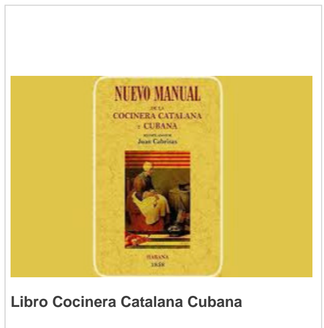
Libro Cocinera Catalana Cubana

Después de este recorrido les traigo: relleno de lechuga, pollo a la castellana y bizcocho a la española, espero los disfruten.