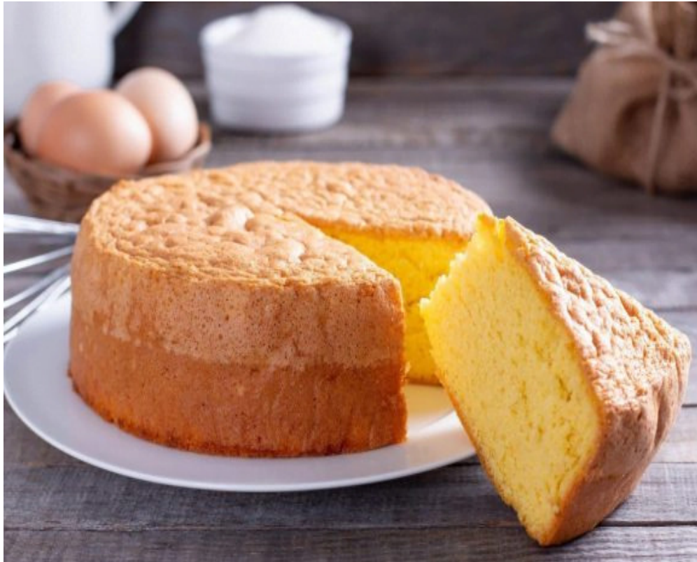
Biscocho a la española