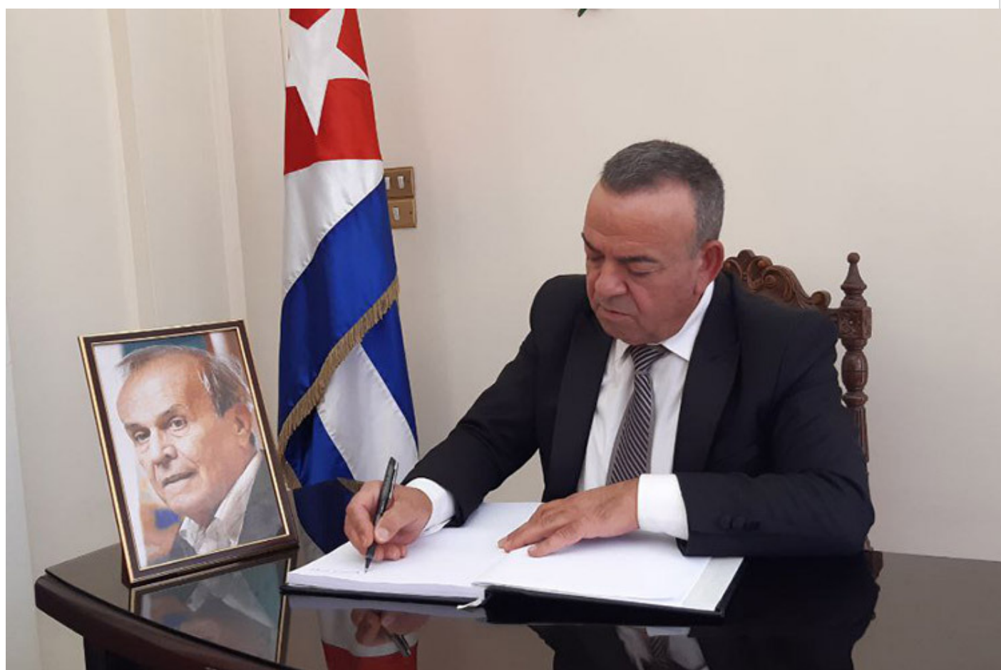
Tributo en Siria a legado de excanciller de Cuba.

Damasco, 13 may (RHC) Representantes del Gobierno y Parlamento sirios y de fuerzas políticas palestinas, así como diplomáticos de diversos países y dirigentes destacaron en Damasco el legado del excanciller cubano Ricardo Alarcón.