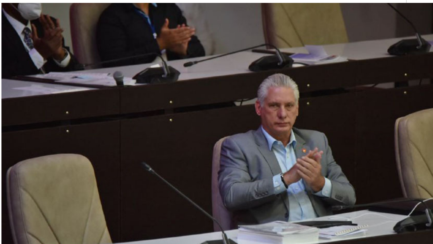
Miguel Díaz-Canel en la primera jornada de la V sesión extraordinaria de la Asamblea Nacional del Poder Popular (ANPP), en su IX Legislatura.

La Habana, 14 may (RHC) Miguel Díaz-Canel Bermúdez, Primer Secretario del Comité Central del Partido Comunista de Cuba y Presidente de la República, participa en la primera jornada de la V sesión extraordinaria de la Asamblea Nacional del Poder Popular (ANPP), en su IX Legislatura.