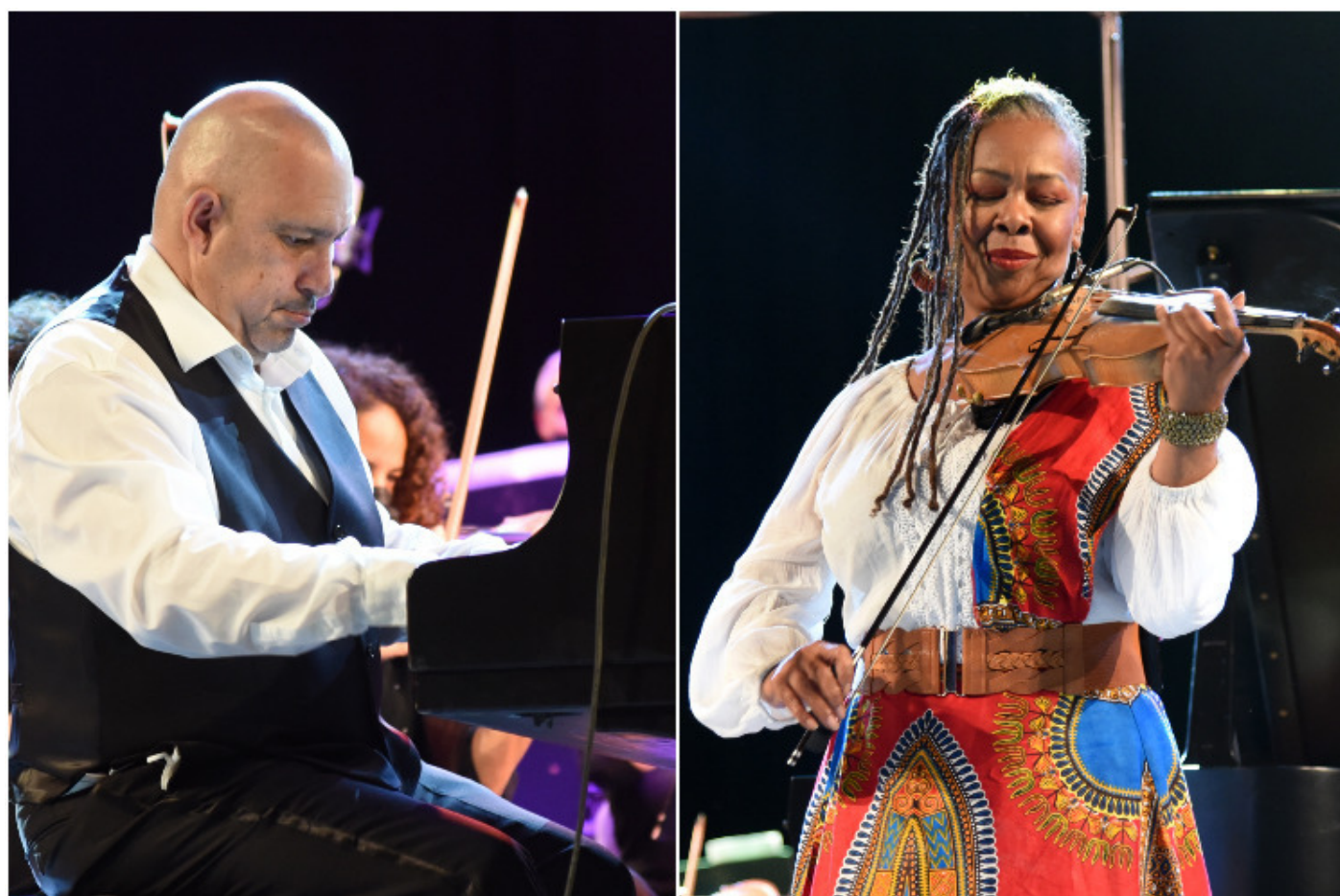
Violinista de EEUU Karen Briggs conquista escena del Cubadisco 2022.

La Habana, 17 may (RHC) La violinista y compositora estadounidense, Karen Briggs, conquistó la escena del evento Cubadisco 2022 durante el concierto inaugural que marcó su debut en La Habana acompañada por el pianista Nachito Herrera y sus invitados.