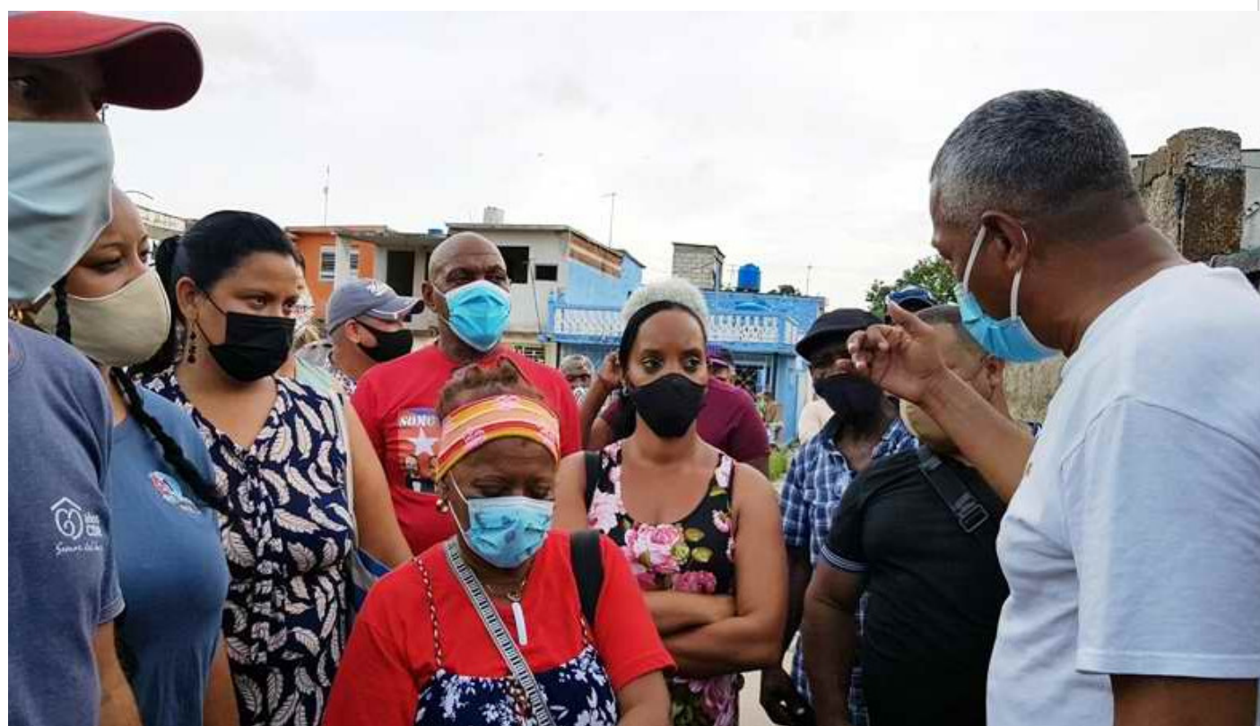
Comenzó visita de trabajo del Secretariado del Comité Central del Partido a Camagüey.

Camagüey, Cuba, 17 may (RHC) Con el propósito de evaluar el estado de cumplimiento de los acuerdos del VIII Congreso del Partido Comunista de Cuba (PCC), el Secretariado del Comité Central del PCC y su estructura auxiliar, llegará a los trece municipios de la provincia de Camagüey.