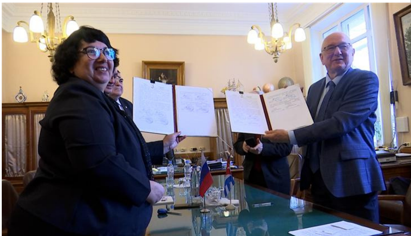
BioCubaFarma y Universidad Estatal de Moscú consolidan sus nexos.

Moscú 17 may (RHC) La representación del grupo empresarial BioCubaFarma en Rusia y la Facultad de Física de la Universidad Estatal de Moscú firmaron este martes un memorándum de cooperación para el desarrollo de dispositivos médicos y el intercambio docente.