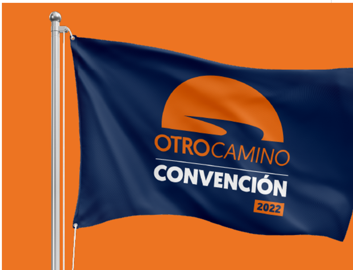
Movimiento Otro Camino en Panamá elige junta directiva.