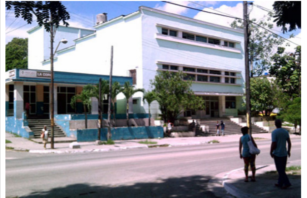
Cine Alameda y La Copa

?La vía se inicia en la Calzada del 10 de Octubre y termina hoy en la Calzada de Rancho Boyeros. Hay sin embargo otra Santa Catalina. Arranca también en la Calzada del 10 de Octubre y se interna en el reparto Lawton hasta morir en Avenida de Acosta, casi al pie del ya desactivado Quinto Distrito Militar y luego de dejar atrás el parque Buttari. Es una Santa Catalina modesta y popular.?