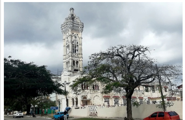
Iglesia San Juan Bosco en Santa Catalina

?En su avance hacia la Calzada de Rancho Boyeros, la avenida pasa por el frente de una dependencia de la Empresa de Bebidas y Licores que fue en su tiempo una embotelladora de la Coca-Cola, una de las tres que dicha compañía tenía en el país; la de Santiago de Cuba, la de Santa Clara y ésta, que se fundó en 1906 en Obrapia entre Aguiar y Cuba, en el espacio donde estuvo después la Bolsa de La Habana. De allí pasó a la calle Alejandro Ramírez, a un costado de la Quinta de Dependientes, y de ahí a Santa Catalina, con 275 trabajadores.