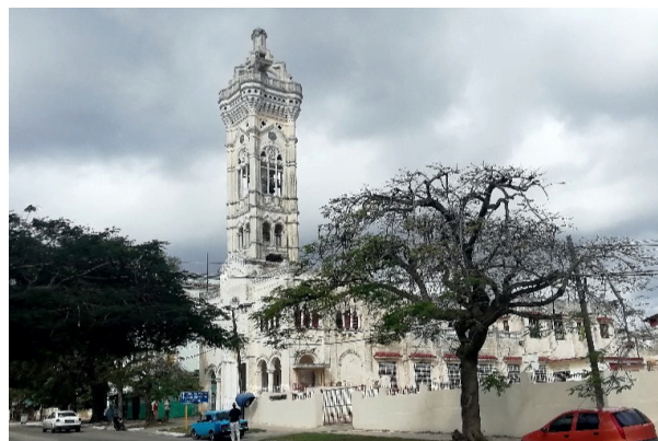
Iglesia San Juan Bosco en Santa Catalina