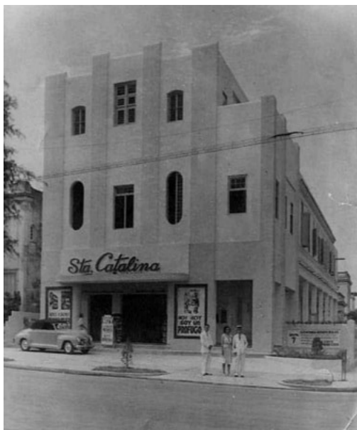
Cine Santa Catalina

A juicio del cronista fue en los años 40 cuando Santa Catalina cobró fisonomía y significación. Es por entonces que el viejo teatro Mendoza, en la intersección con Juan Delgado, se remodela y adquiere el nombre de cine Santa Catalina (hoy teatro para niños La Edad de Oro).