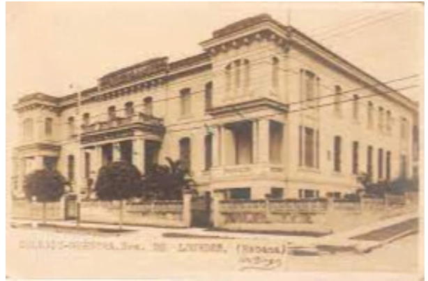
Antiguo colegio Nuestra señora de Lourdes

Entre las escuelas de la calle sobresale el antiguo colegio Nuestra Señora de Lourdes, (hoy escuela Mariana Grajales) en la esquina de Santa Catalina y Saco. La clínica Pasteur (hoy policlínico) dejó su sede en la Calzada del 10 de Octubre número 1158 y se instaló a fines de los 50 en el número 108 de Santa Catalina, mientras que la clínica Santa Isabel abandonaba su local en esta calle para, por la misma época, estrenar edificio propio en la esquina de Mayía Rodríguez y Freire de Andrade. La hoy llamada funeraria de La Víbora, en el número 265, seguirá siendo Pompas Oliva para quien esto escribe.