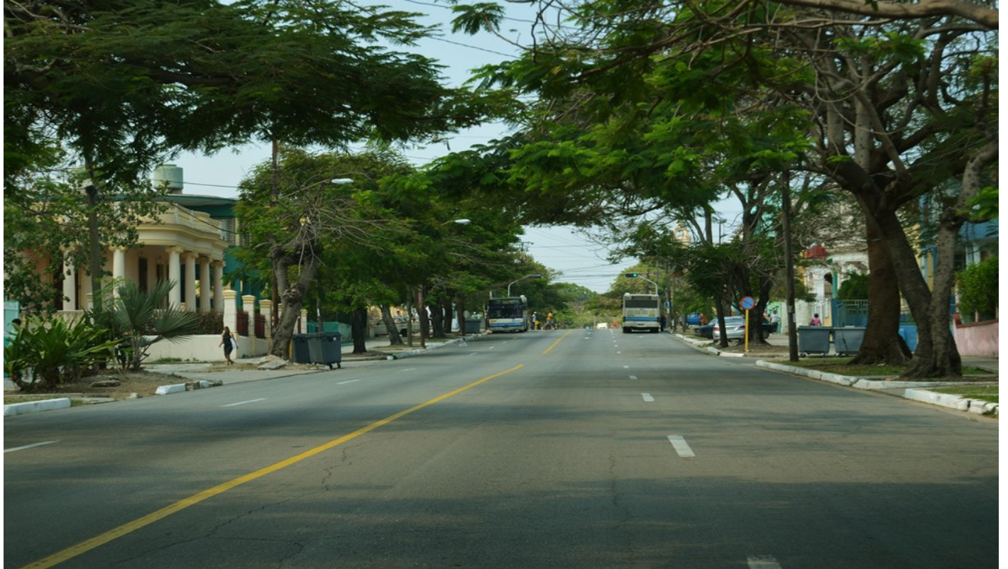
Avenida Santa Catalina