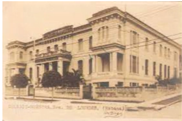
Antiguo colegio Nuestra señora de Lourdes

?En su avance hacia la Calzada de Rancho Boyeros, la avenida pasa por el frente de una dependencia de la Empresa de Bebidas y Licores que fue en su tiempo una embotelladora de la Coca-Cola, una de las tres que dicha compañía tenía en el país; la de Santiago de Cuba, la de Santa Clara y ésta, que se fundó en 1906 en Obrapia entre Aguiar y Cuba, en el espacio donde estuvo después la Bolsa de La Habana. De allí pasó a la calle Alejandro Ramírez, a un costado de la Quinta de Dependientes, y de ahí a Santa Catalina, con 275 trabajadores.