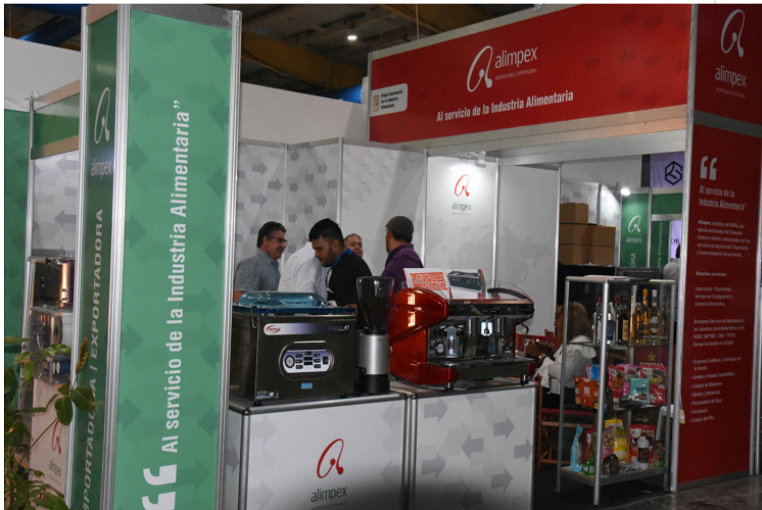
Alianzas para impulsar nuevos actores económicos en Cuba.

La Habana, 25 may (RHC) La Feria de Alimentos Cuba 2.0 continúa este miércoles en Pabexpo con el propósito de convertirse en un espacio de alianzas en pos del desarrollo del sector, donde los nuevos actores económicos ocupan un espacio relevante.