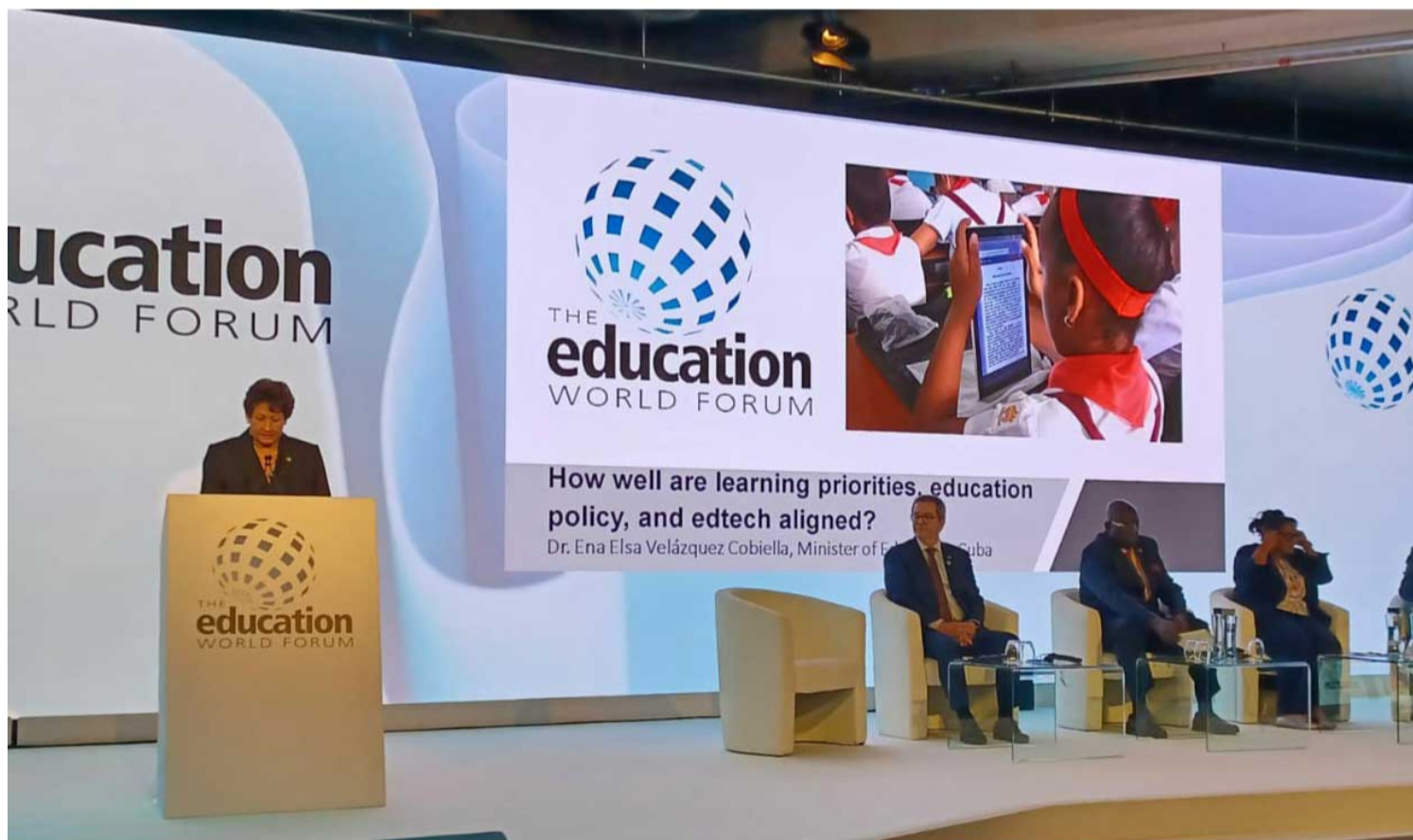
Ministra de Educación Ena Elsa Velázquez.

Londres, 25 may (RHC) Cuba expuso sus experiencias y logros en el Foro Mundial de Educación que sesiona en Londres y llamó a los participantes a unir esfuerzos para enfrentar los cambios culturales, tecnológicos y políticos actuales.