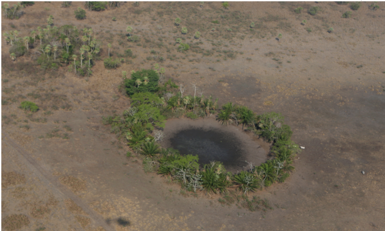
Un reservorio prehispánico de 60 metros de diámetro en Landívar, Bolivia.

La Paz, 26 may (RT) Un equipo de investigadores dirigido por el Instituto Arqueológico Alemán descubrió entre la densa vegetación de la Amazonía boliviana restos arqueológicos de urbanismo prehispánico de baja densidad hasta ahora desconocidos, comunica la entidad.