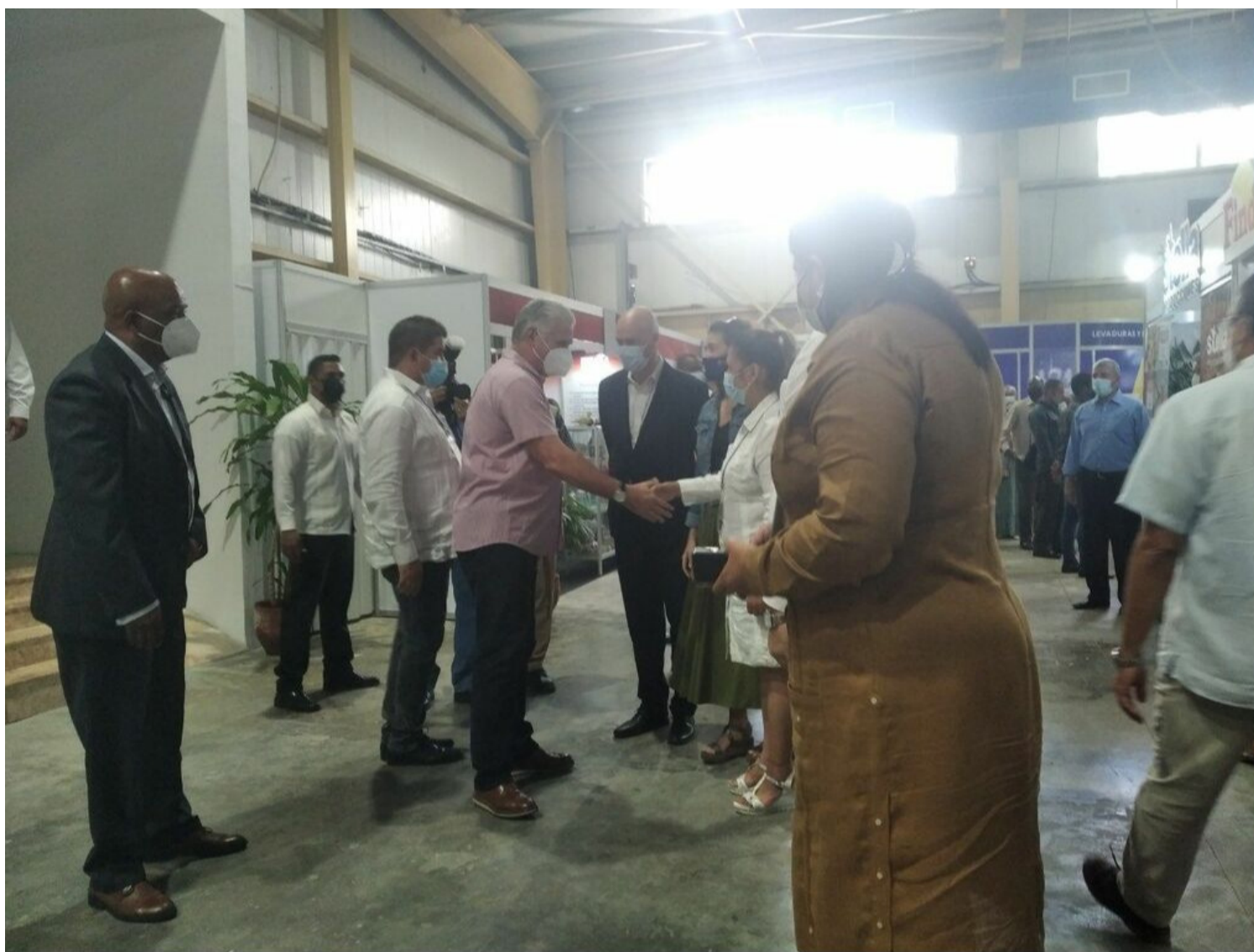
El dignatario saluda a los participantes en el encuentro.