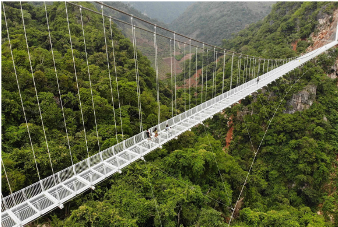
Foto aérea que muestra el puente de vidrio Bach Long rodeado de verde.

Hanoi, 30 may (RHC) Vietnam cuenta desde este fin de semana con el puente de cristal más largo del mundo, tras su inauguración oficial en la norteña provincia de Son.