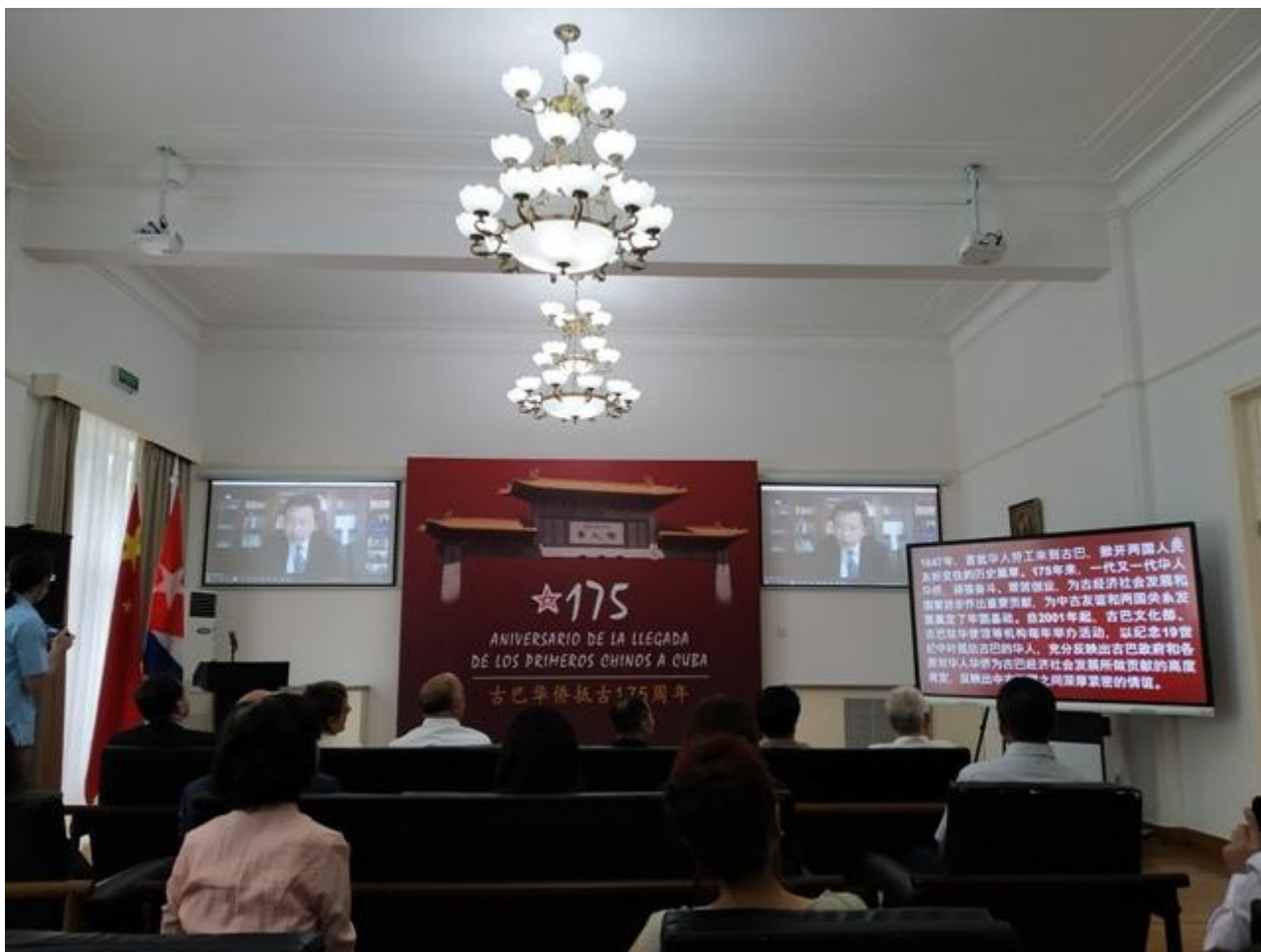
Conmemoran 175 años de llegada de primeros chinos a Cuba.

Beijing, 6 jun (RHC) Representantes de Cuba y China realizaron este lunes un seminario académico para conmemorar el aniversario 175 de la llegada de los primeros ciudadanos del gigante asiático a la nación caribeña y destacar su aporte a la identidad nacional.