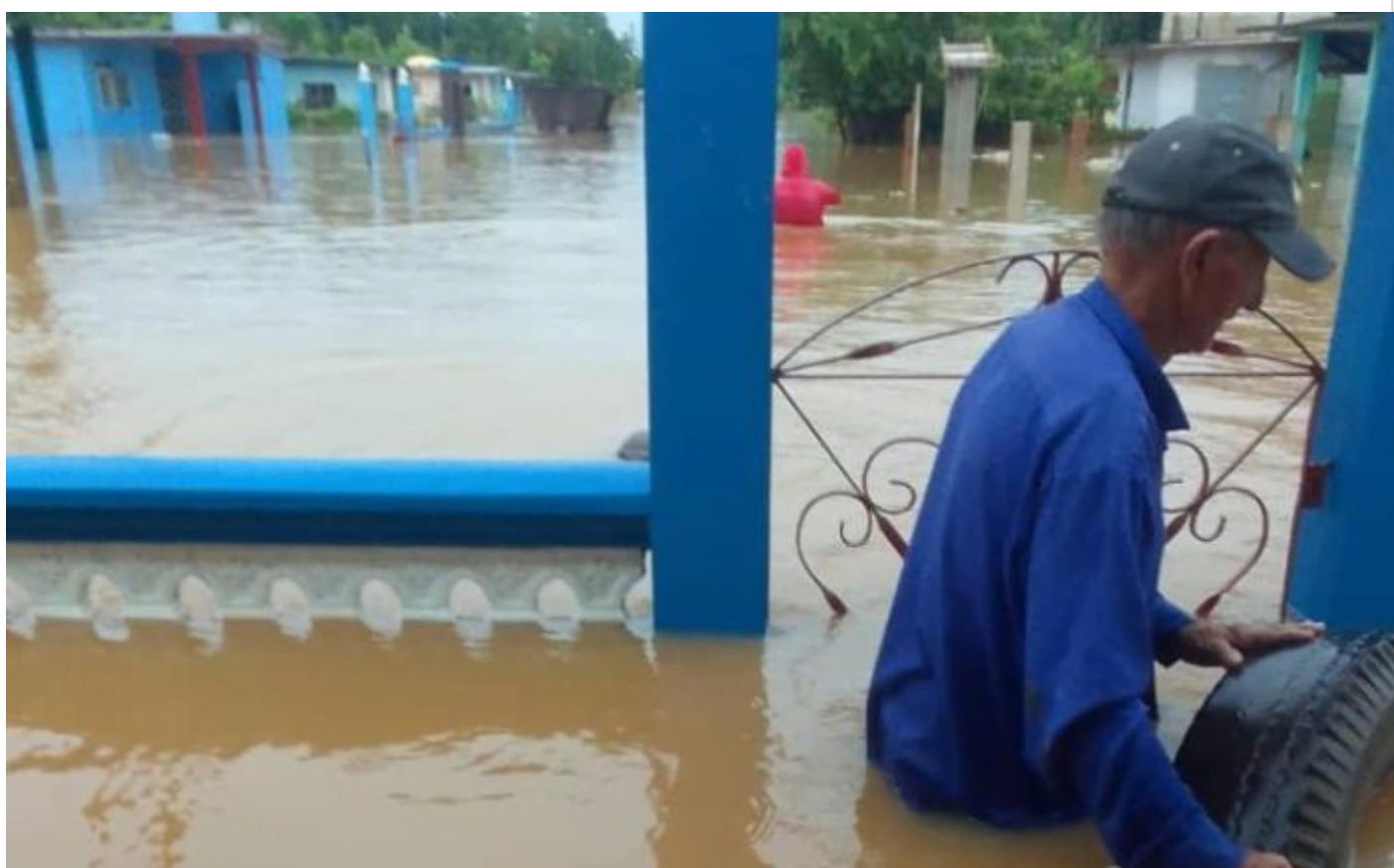
Inundaciones en Matanzas.

Matanzas, 8 jun (RHC) Las fuertes y persistentes lluvias, azotaron casi sin cesar y por varios días a la provincia occidental Matanzas, provocando inundaciones en zonas bajas, de los municipios de Martí, Jovellanos, Unión de Reyes, Pedro Betancourt, Perico, Cárdenas, y la ciudad cabecera, con daños también a viviendas y plantaciones agrícolas.