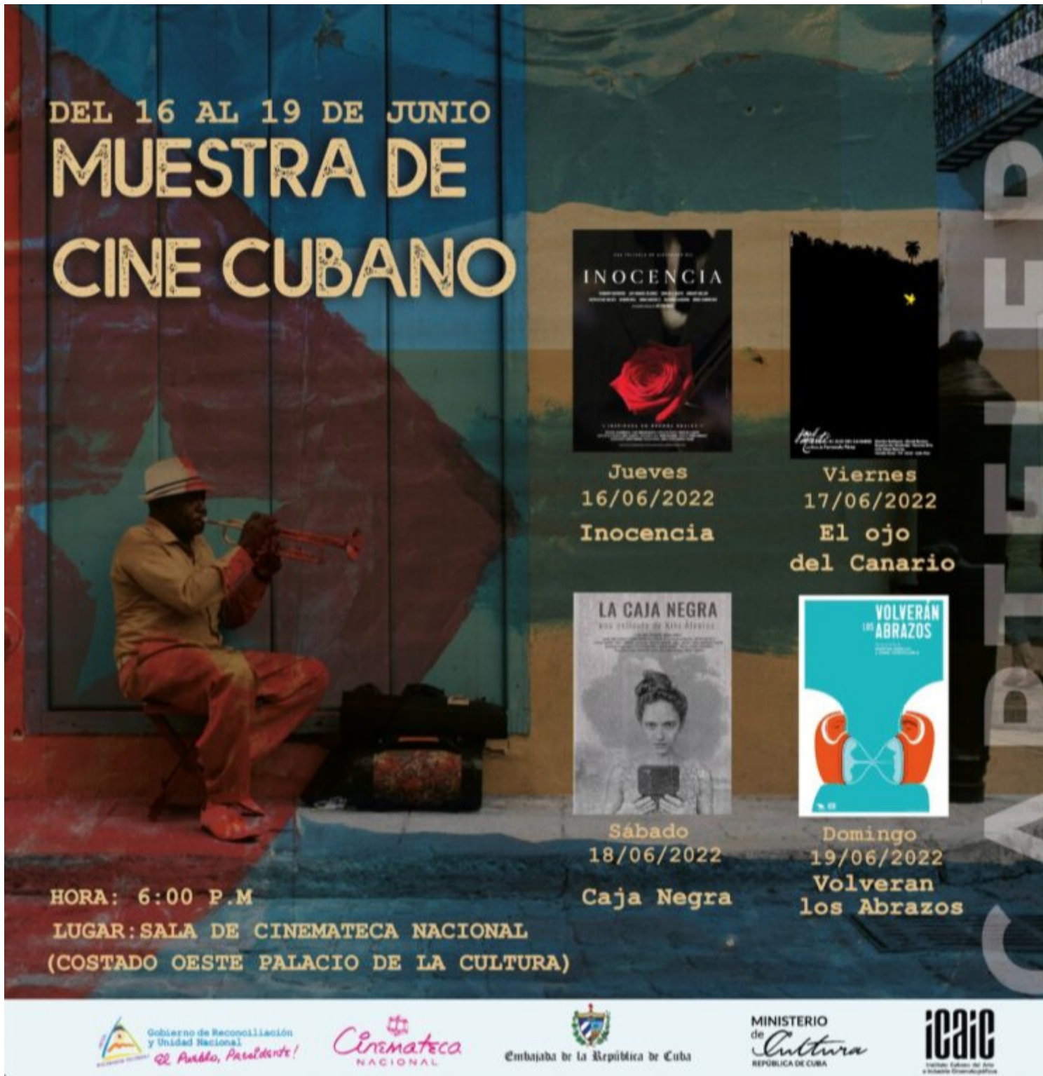
Concluye muestra de cine cubano en Nicaragua.

Managua, 19 jun (RHC) Con la proyección del documental “Volverán los abrazos” (2021) de los realizadores Jonal Cosculluela y Maritza Ceballo, concluyó este domingo en Managua una muestra de cine cubano.