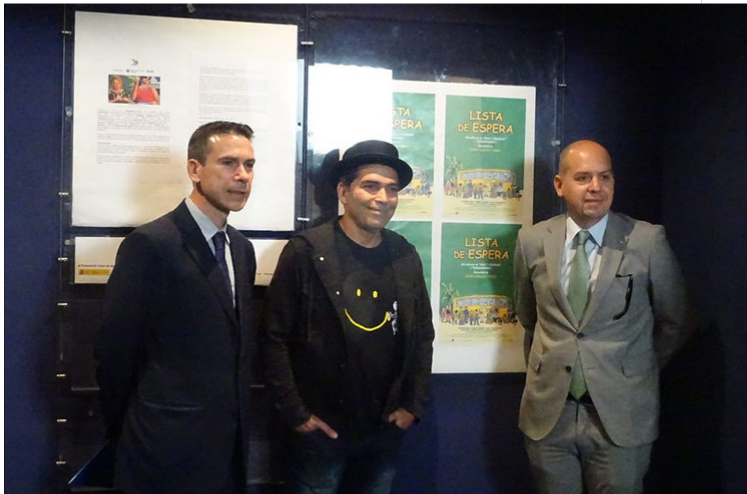
La presencia de Vladimir Cruz (Fresa y chocolate) dio lustre a la velada.

Madrid, 24 jun (RHC) Un homenaje al desaparecido realizador Juan Carlos Tabío marcó este viernes el comienzo de las jornadas de cine cubano en Casa de América de Madrid, con la proyección de Lista de espera.