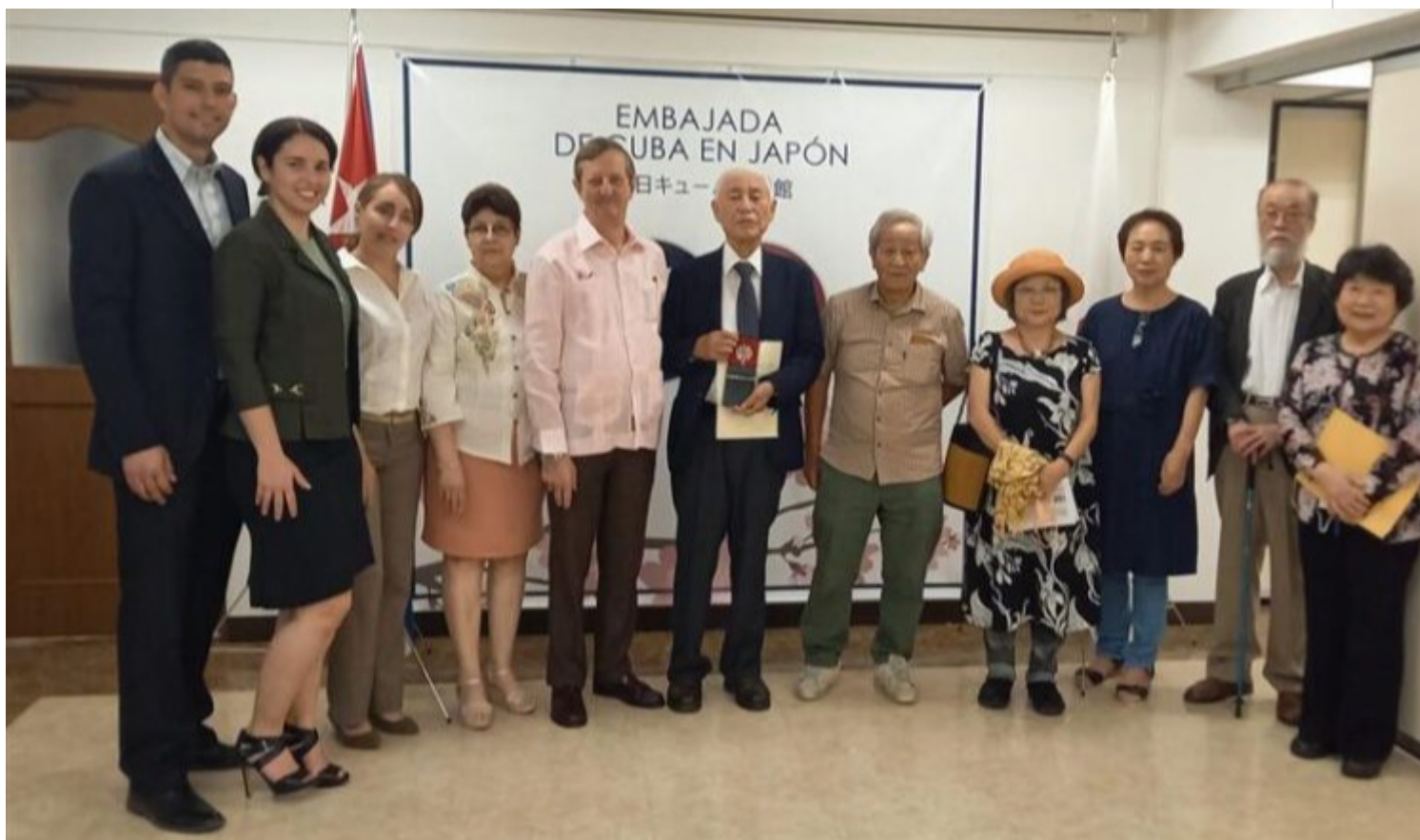
Reconocen en Japón a grupo de solidaridad con Cuba.

Tokio, 28 jun (RHC) La Mesa Redonda para la Amistad con Cuba recibió este martes en Tokio el sello conmemorativo 60 Aniversario del Instituto Cubano de Amistad con los Pueblos (ICAP).