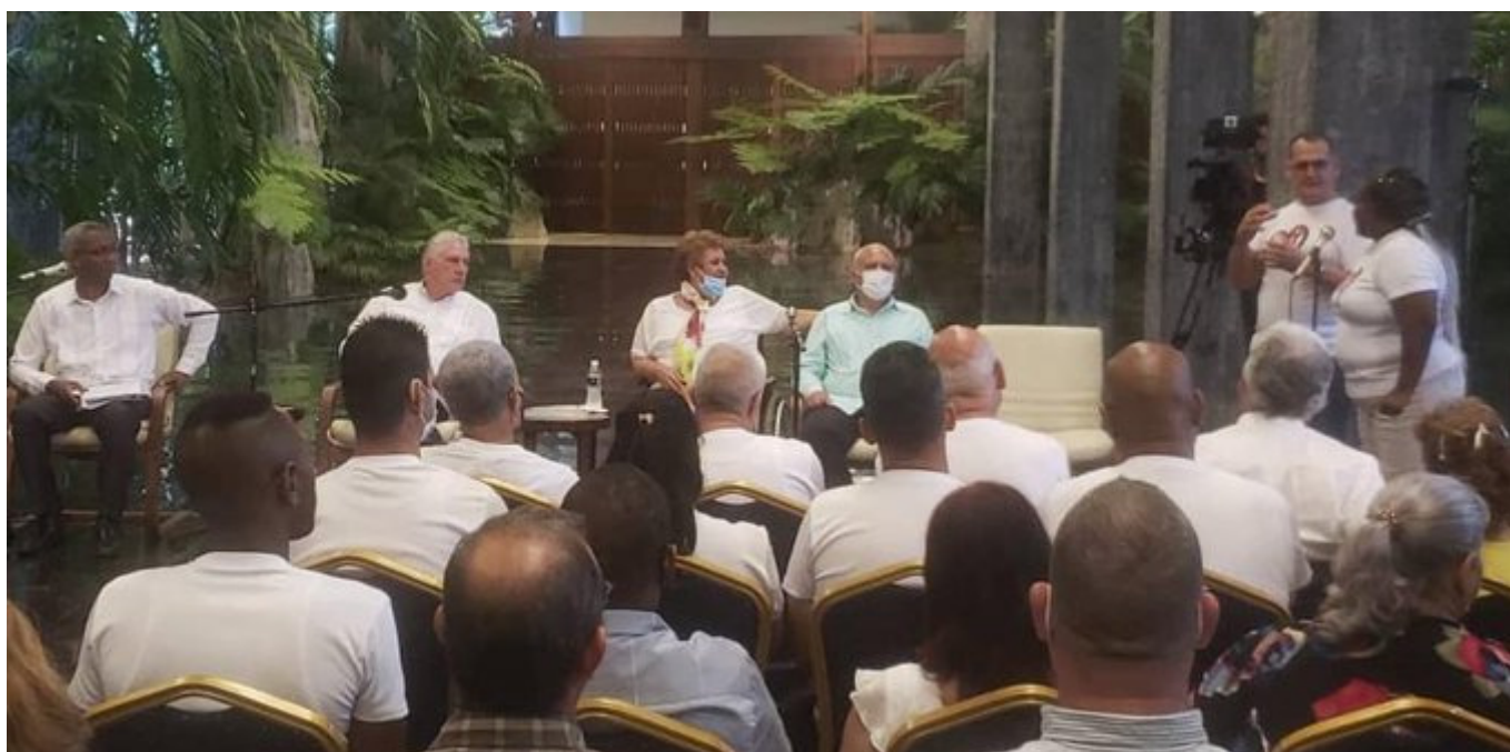
Díaz-Canel dialoga con organizaciones de discapacitados en Cuba.

La Habana, 30 jun (RHC) El presidente de Cuba, Miguel Díaz-Canel, dialogó este jueves con miembros de organizaciones de discapacitados del país que acogen a más de 140 mil personas.