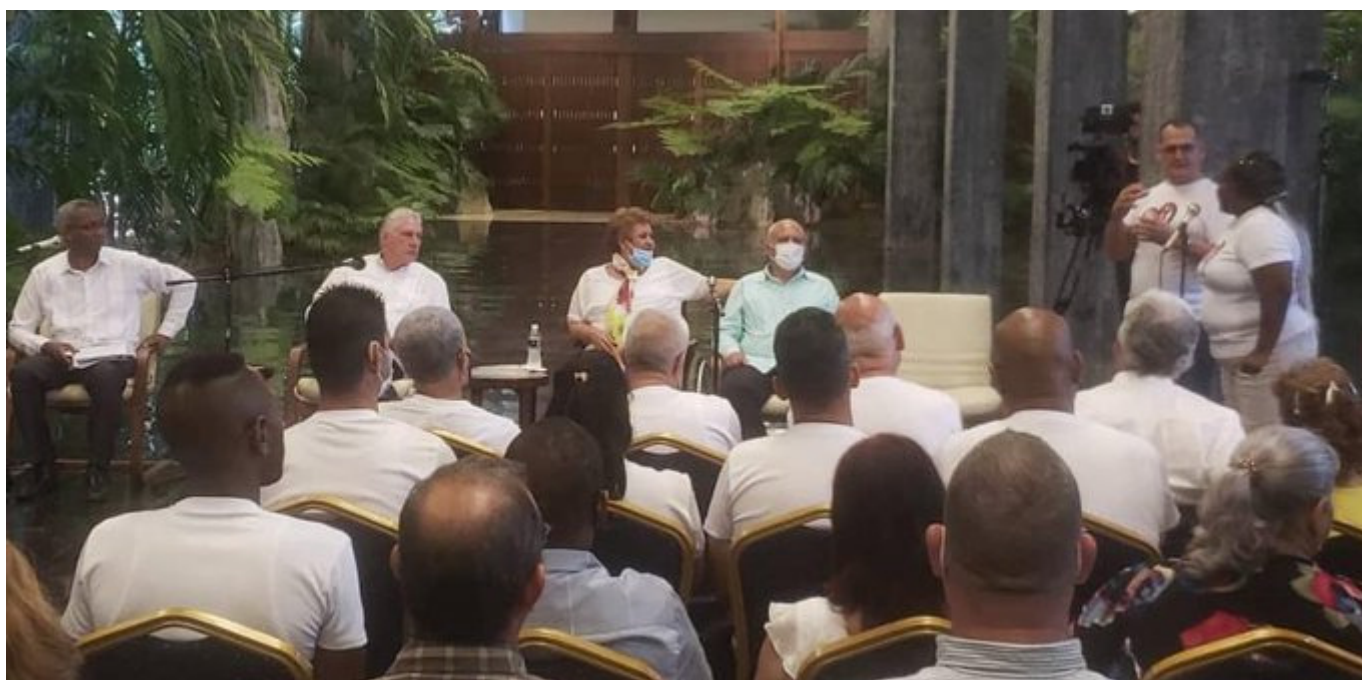
Díaz-Canel dialoga con organizaciones de discapacitados en Cuba.

La Habana, 30 jun (RHC) El presidente de Cuba, Miguel Díaz-Canel, dialogó este jueves con miembros de organizaciones de discapacitados del país que acogen a más de 140 mil personas.