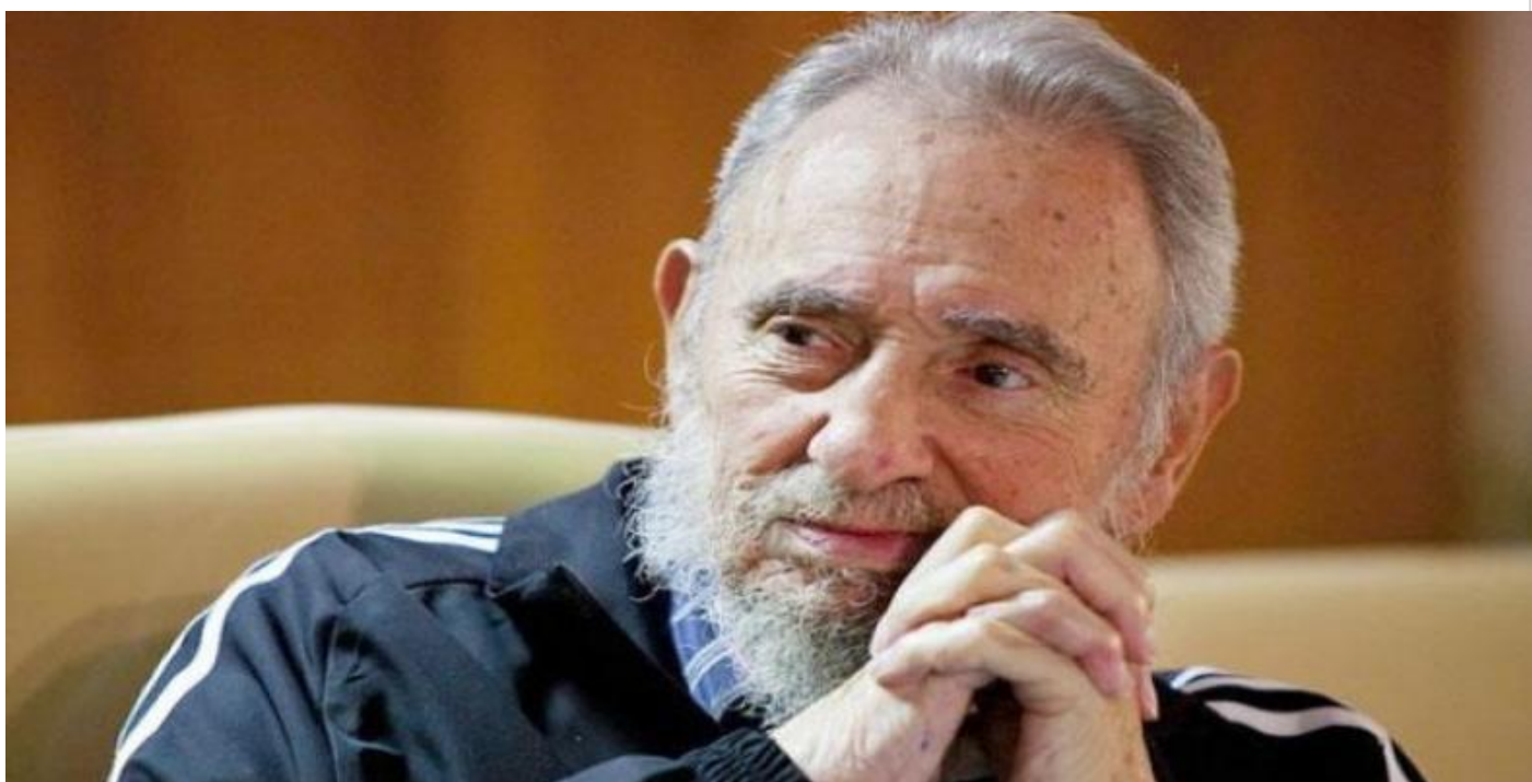
Fidel Castro Ruz (1926-2016)

La Habana, 5 jul (RHC) El presidente de Casa de las Américas, Abel Prieto evocó este martes el pensamiento crítico de Fidel Castro (1926-2016) como referente teórico invaluable para deconstruir el colonialismo cultural, herramienta de dominación hegemónica en detrimento de las identidades nacionales.