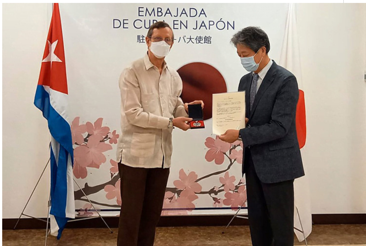
Federación Japonesa de Instituciones Médicas Democráticas recibió el sello conmemorativo 60 Aniversario del Icap.

Tokio, 6 jul (RHC) La Federación Japonesa de Instituciones Médicas Democráticas (Min-Iren) recibió este miércoles en Tokio el sello conmemorativo 60 Aniversario del Instituto Cubano de Amistad con los Pueblos (ICAP).