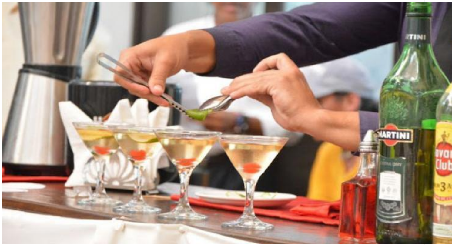
Campeonato Mundial de Coctelería, con sede en el Hotel Meliá Internacional de Varadero.