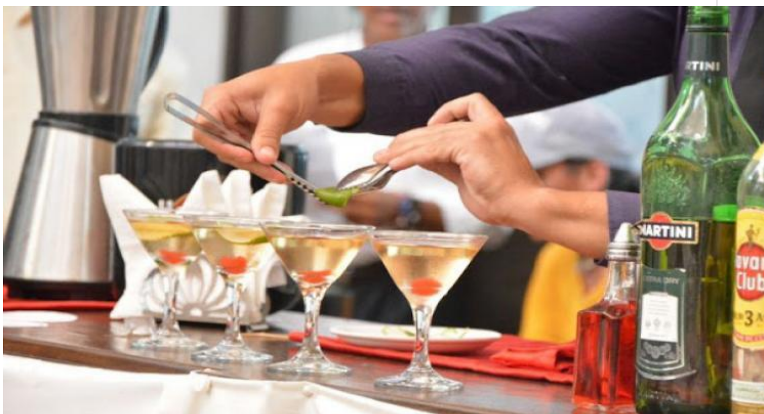
Campeonato Mundial de Coctelería, con sede en el Hotel Meliá Internacional de Varadero.