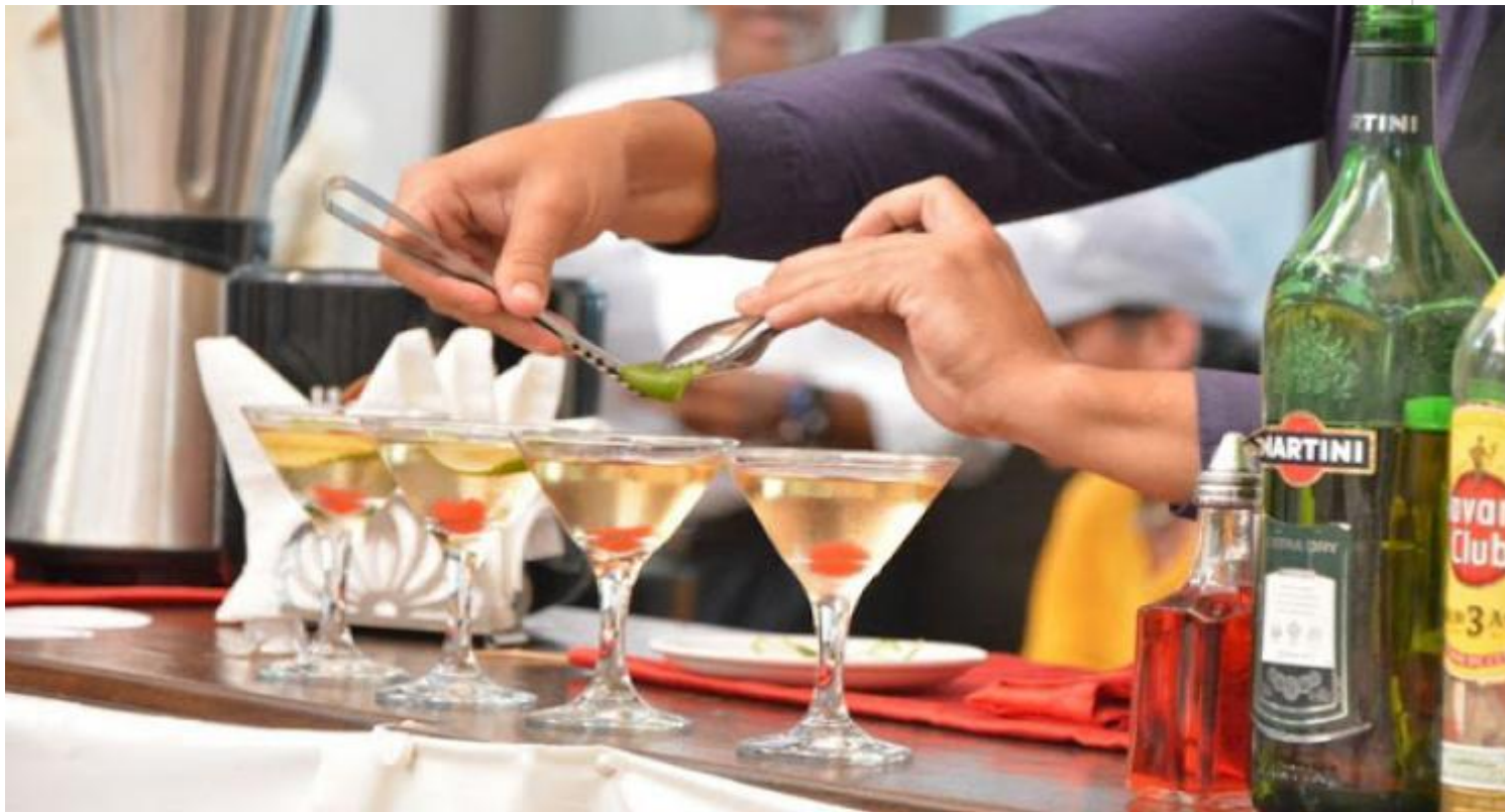
Campeonato Mundial de Coctelería, con sede en el Hotel Meliá Internacional de Varadero.