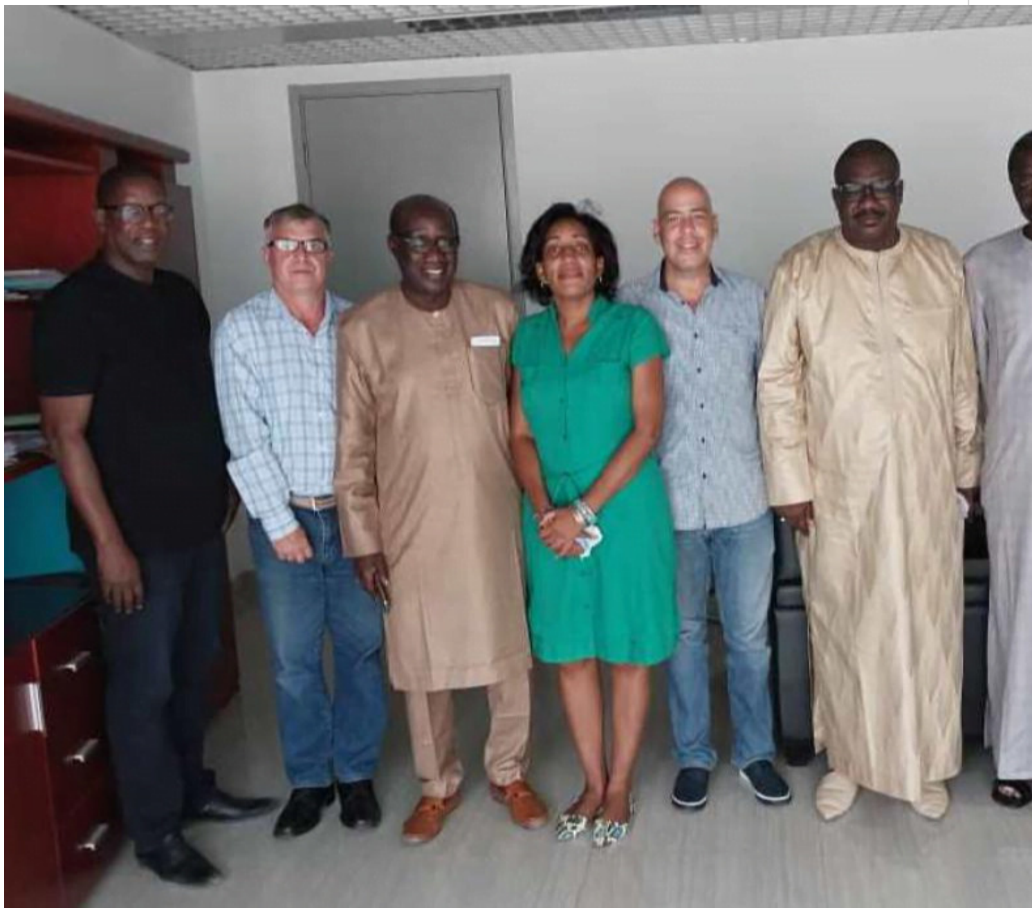
Senegal por impulsar lazos culturales con Cuba.