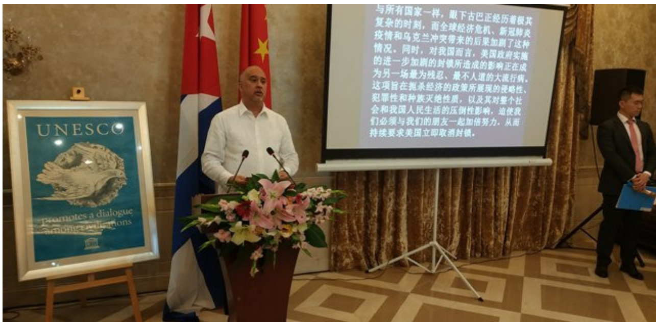
Representantes de Cuba en China denunciaron hoy una campaña de desestabilización política y descrédito contra el país.

Beijing, 7 jul (RHC) Representantes de Cuba en China denunciaron este jueves una campaña de desestabilización política y descrédito contra la nación caribeña impulsada desde Estados Unidos, con llamados a la violencia y la intención de crear pretextos para una intervención humanitaria.