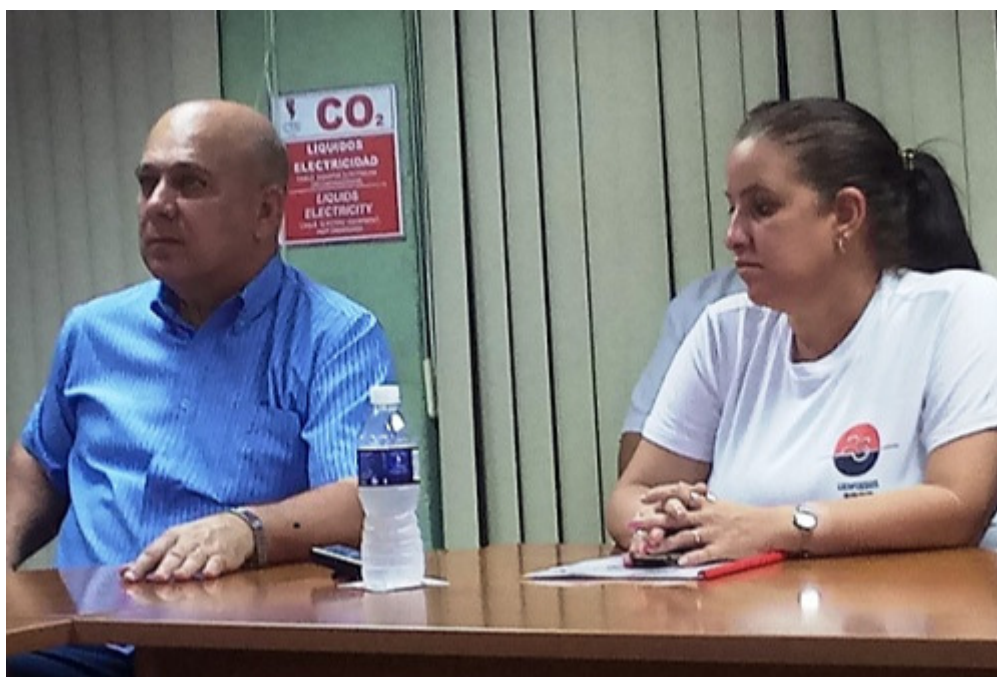
Morales Ojeda llamó a la población a reducir el consumo de electricidad.