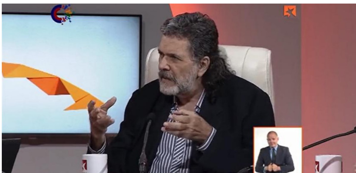
Prieto evocó al líder histórico de la Revolución, Fidel Castro Ruz.

La Habana, 11 jul (RHC) Intelectuales de Cuba analizaron este lunes el andamiaje mediático detrás del intento de golpe de Estado vandálico orquestado por el Gobierno de Estados Unidos y el valor esencial de la cultura, a un año de esos actos.