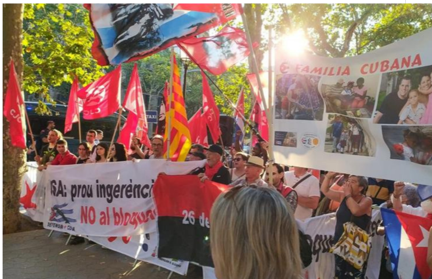
Barcelona destaca con actos de apoyo a Revolución cubana.

Barcelona, España, 12 jul (RHC) Numerosas muestras de apoyo a la Revolución cubana destacaron en las últimas horas en Barcelona, donde la frase "Trenquem el bloqueig" (rompamos el bloqueo) dominó las concentraciones.