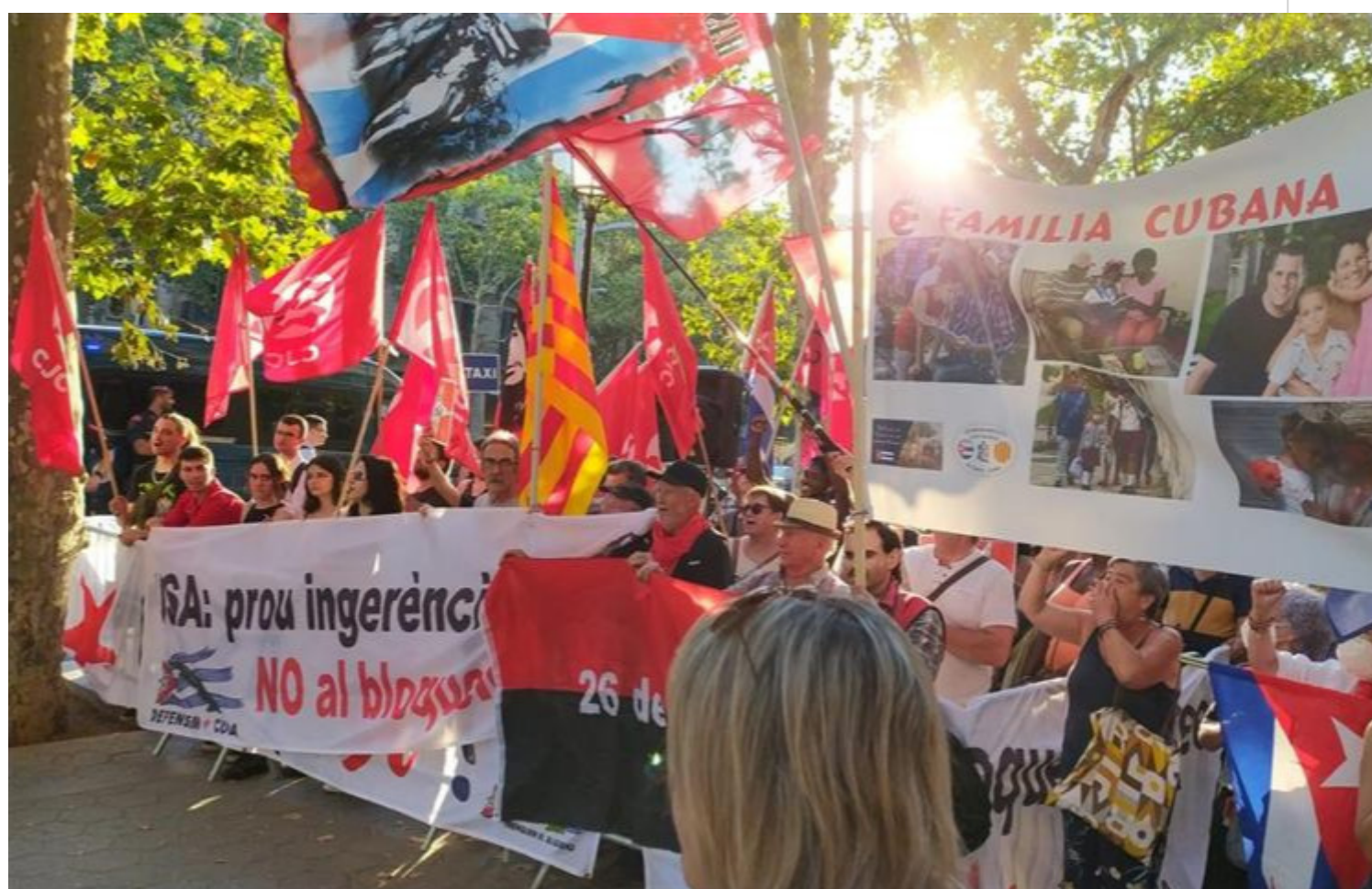
Barcelona destaca con actos de apoyo a Revolución cubana.

Barcelona, España, 12 jul (RHC) Numerosas muestras de apoyo a la Revolución cubana destacaron en las últimas horas en Barcelona, donde la frase "Trenquem el bloqueig" (rompamos el bloqueo) dominó las concentraciones.