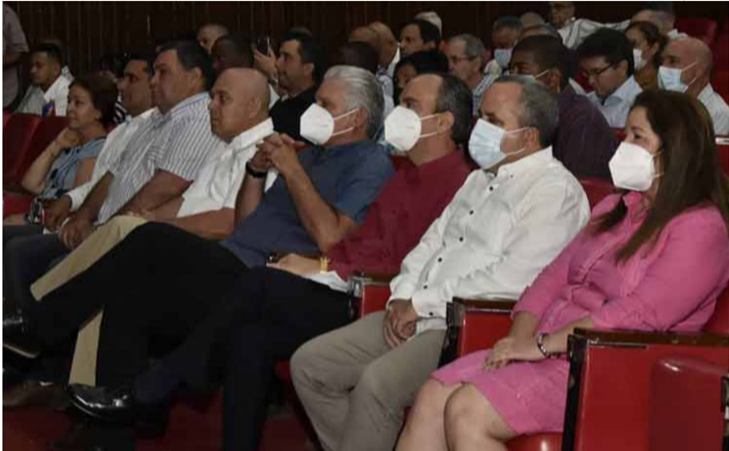
Une commémoration entre dirigeants, fonctionnaires et travailleurs du PCC.

La Havane, 19 juillet (RHC) Le premier secrétaire du Comité central du Parti communiste de Cuba et président de la République, Miguel Diaz-Canel a présidé ce mardi le meeting politique et culturel pour