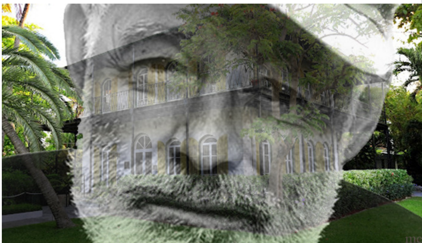
Museo Ernest Hemingway