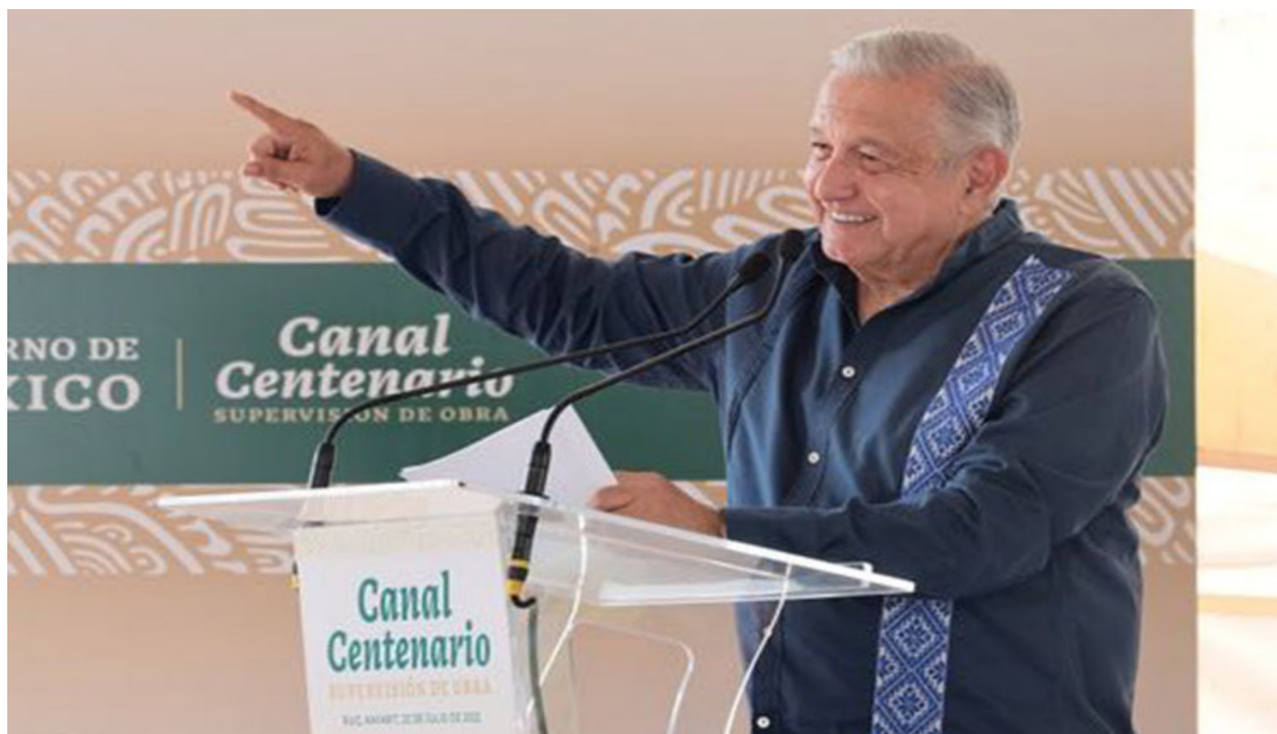
Lopez Obrador recibe médicos cubanos en Nayarit

Ciudad de México, 24 jul (RHC) El primer grupo de ocho médicos cubanos de los 500 contratados por el gobierno de México, laborarán en un hospital del estado de Nayarit donde los recibió el presidente Andrés Manuel López Obrador.