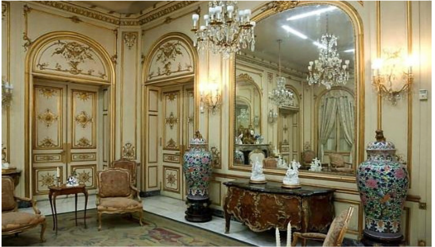
Salón Principal museo Artes Decorativas