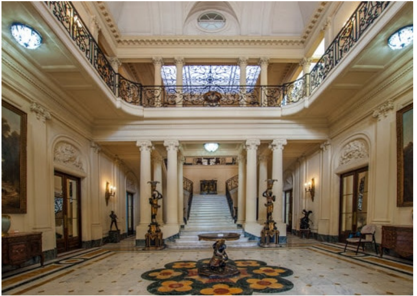
Interior del museo de Artes decorativas

Según recordó Fornaris, en un inicio sólo se expusieron las colecciones originales existentes en la casa convertida en museo, y posteriormente se sumaron otras mediante donaciones, compras y depósitos.