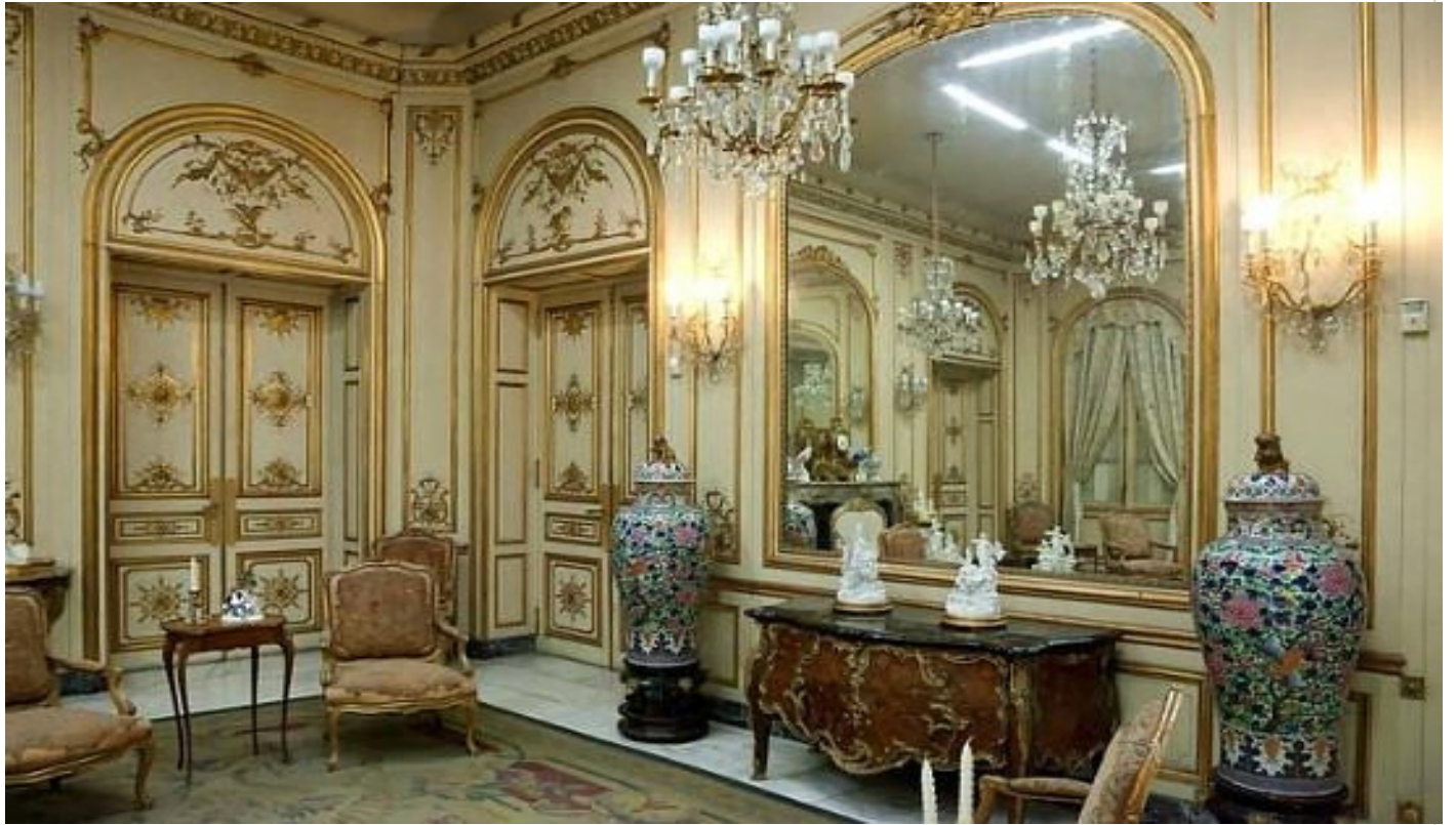
Salón Principal museo Artes Decorativas