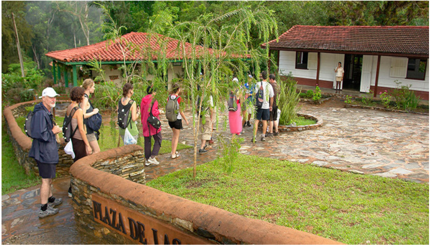
Casa campesina Guanayara

Ese sendero lleva por cruces sobre piedras y riachos, con la belleza majestuosa del lugar, y el sonido melodioso del río, hasta llegar al Salto del Rocío, donde los caminantes hacen alto.