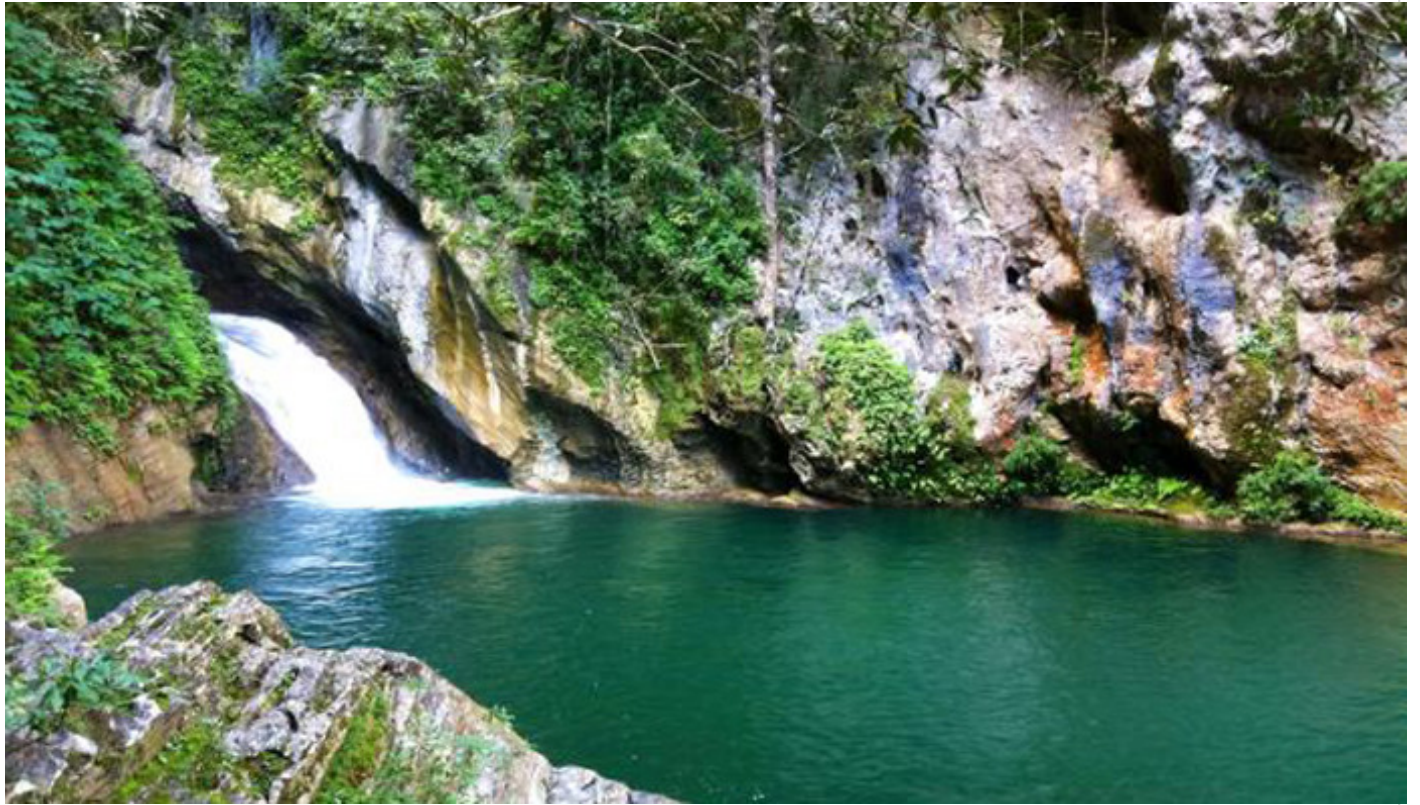
Poceta del Venao

Salto de agua y pocetas completan el panorama, además de tener un descanso en una casa de campesinos, con el apropiado café criollo y frutas de la región, para amortiguar la caminata. (Tomado de PL)