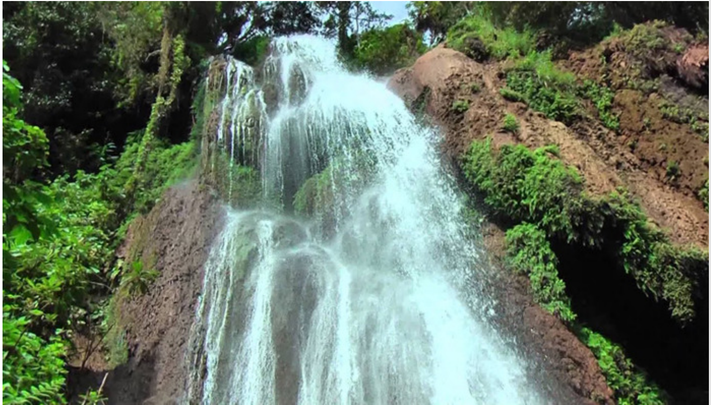
Salto de El Rocío

El otro sendero, de los tantos que existen por el lugar programado para un turismo de naturaleza, es el de Los Helechos, con mil 330 metros de viaje y observación del río, flora y avifauna.