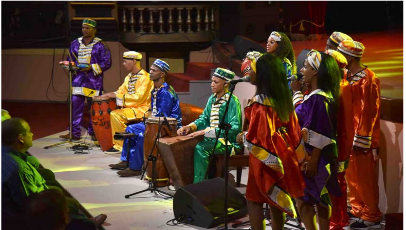
Gala por el 26 de Julio en Cienfuegos

No pudieron faltar al convite otras expresiones musicales identificativas del ser nacional, el punto cubano y sus tonadas, propio del campesinado, y la rumba de rica raíz africana nacida en los barrios más pobres de las ciudades de La Habana y Matanzas.