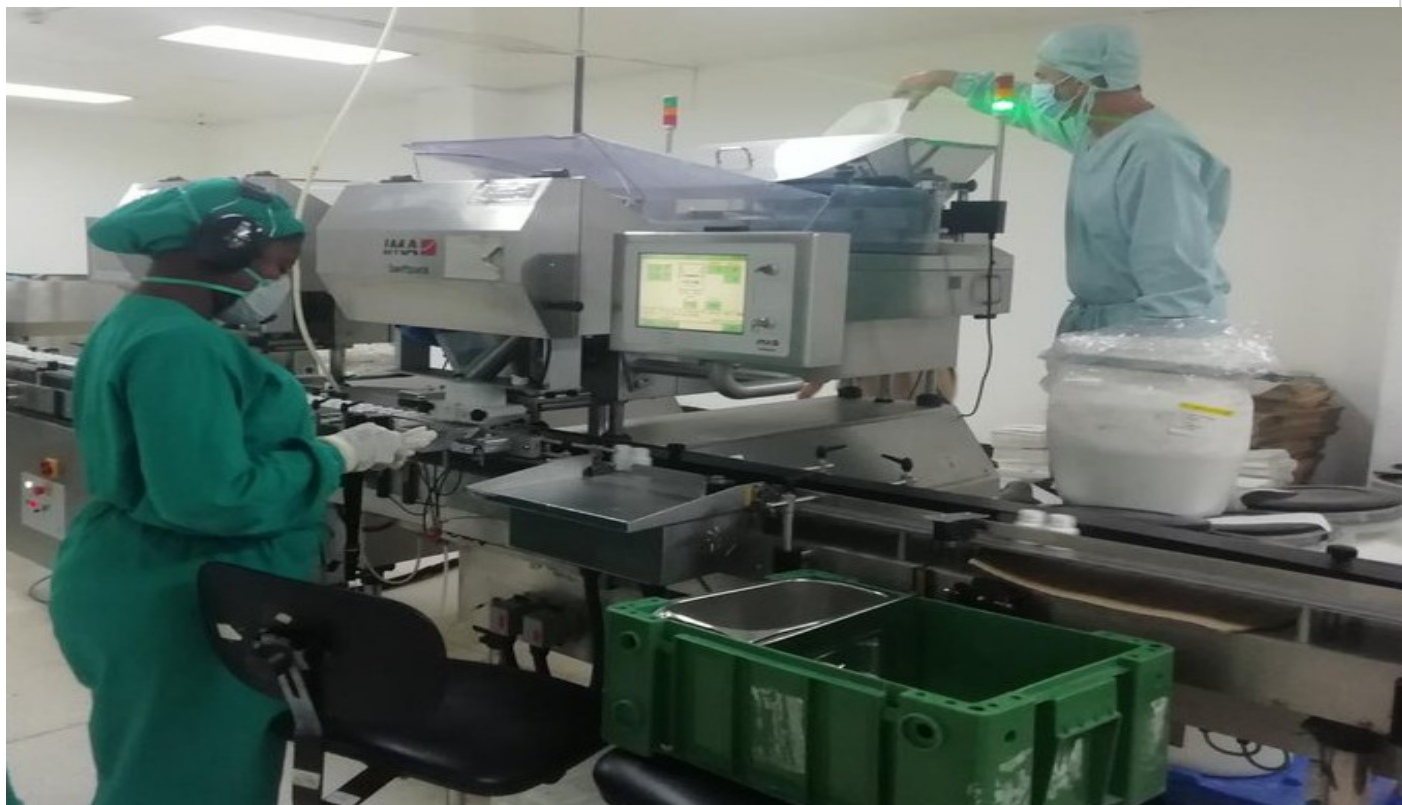
Avanza producción de medicamentos

La Habana, 26 julio (RHC) La producción de algunos medicamentos de alta demanda entre la población cubana, se restablece por estos días, en las plantas productoras de la unidad empresarial de base (UEB) Novatec, perteneciente a la Empresa Laboratorios MedSol, informó el diario Granma.