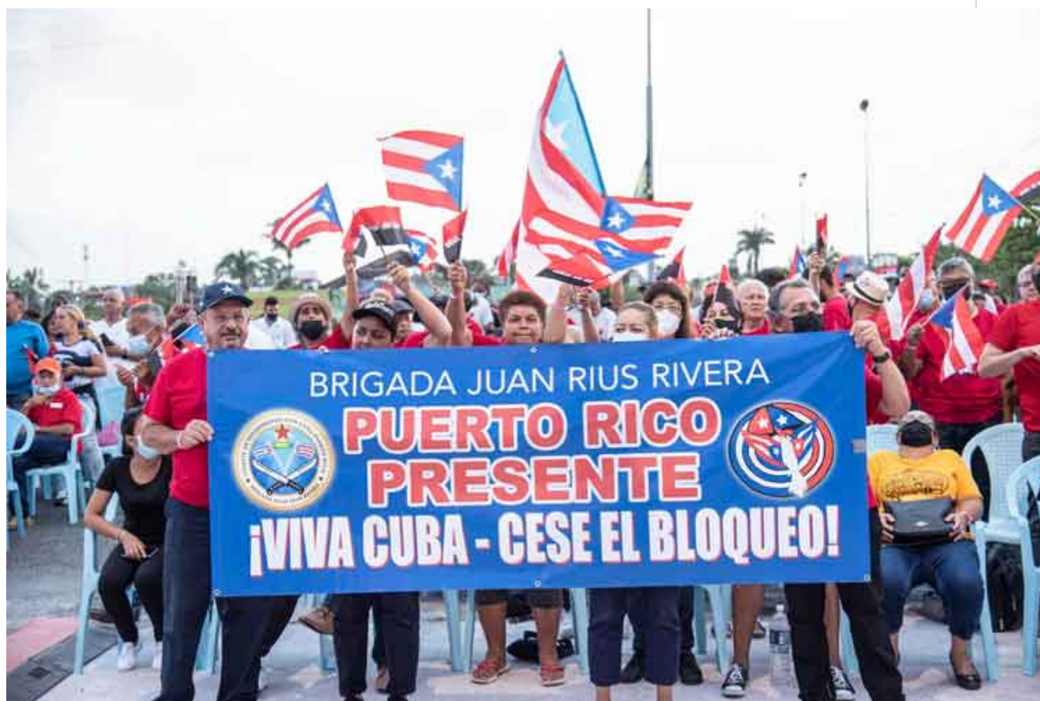
Les amis de Cuba accompagnent le peuple lors de la Journée nationale de la rébellion.

Cienfuegos, Cuba, 26 juillet (RHC) Des membres de la XXXIle Caravane des Pasteurs pour la Paix, des brigades Juan Rius Rivera y Venceremos et du Parti Socialisme et Libération (États-Unis) ont accompagné mardi le peuple à l'occasion de la Journée de la Rébellion Nationale.