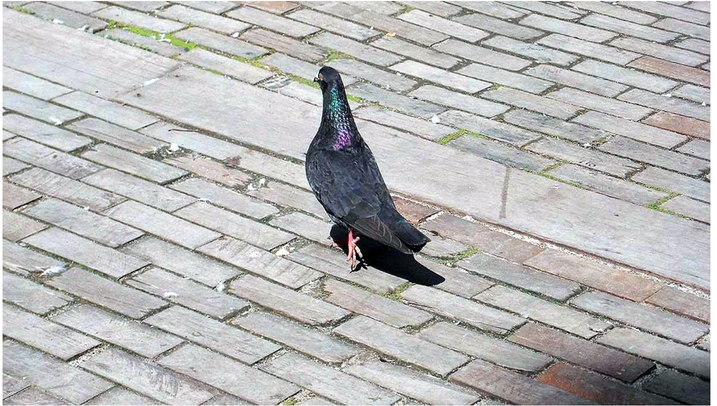
Calle de adoquines de madera

Pero ellos no lo olvidan. ¿Cómo hacerlo si respira en cada adoquín de la Calle de Madera, saluda desde cada plaza, dobla por cualquier esquina del Centro Histórico, con sus ropajes de azul y gris, camina hasta el Museo de la Ciudad y se sienta en su banco favorito del patio interior?