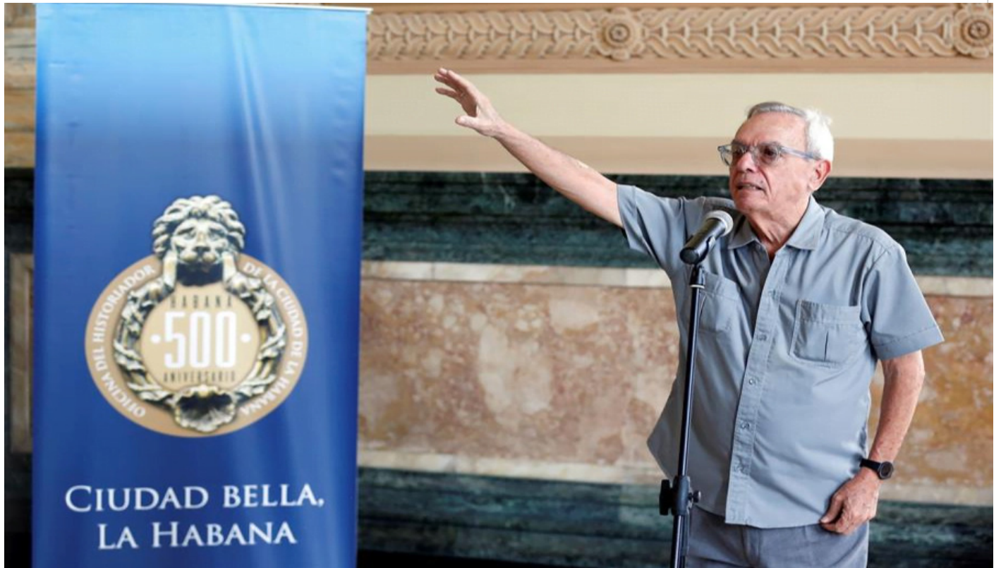
Eusebio 500 años de La Habana

Esa es, entonces, la mejor forma de recordarlo, trabajar sin descanso para preservar lo que se logró y continuar creciendo; para que La Habana no muera nunca, como no lo hará él. (Tomado del diario Granma)