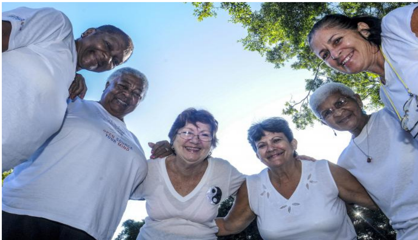
Personas de la Tercera edad